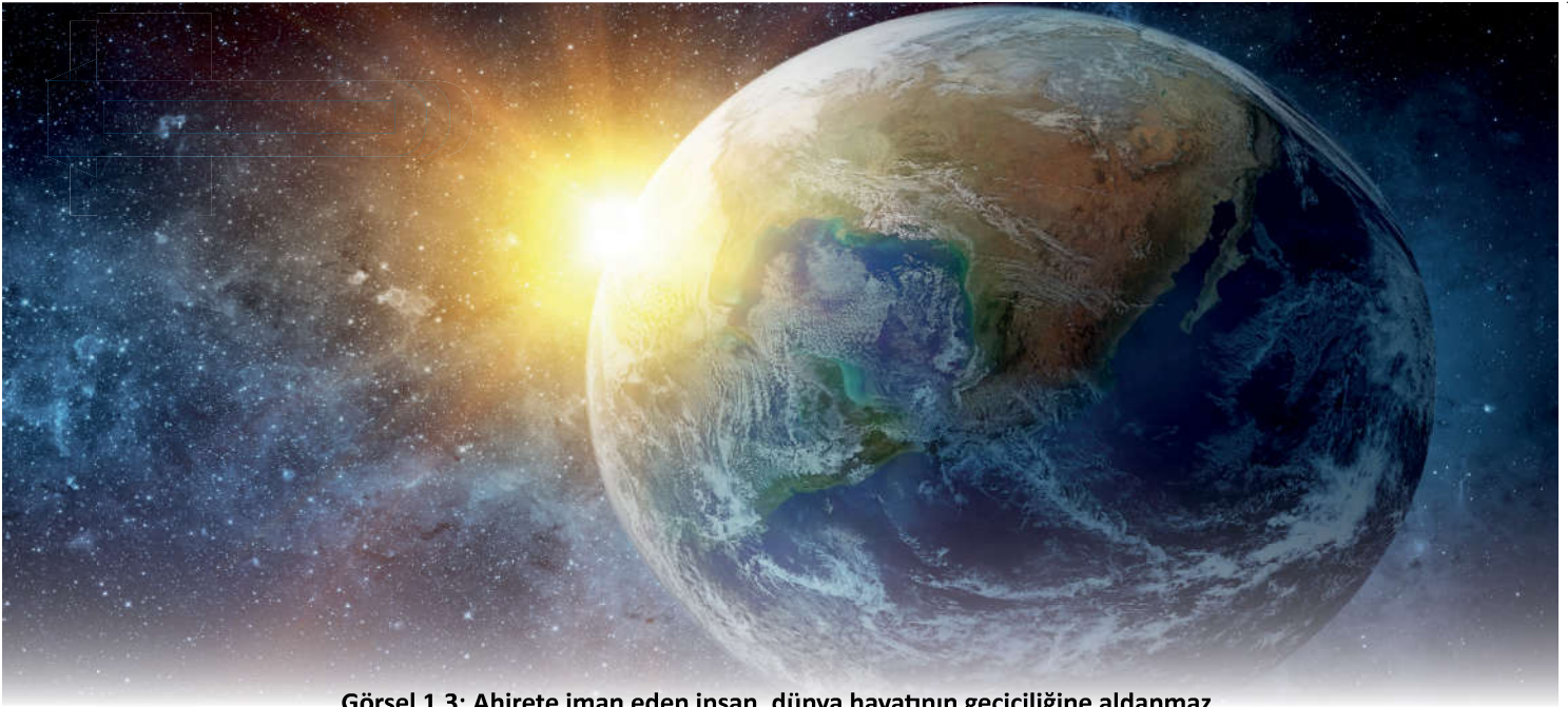
Görsel 1.3: Ahirete iman eden insan, dünya hayatının geçiciliğine aldanmaz.