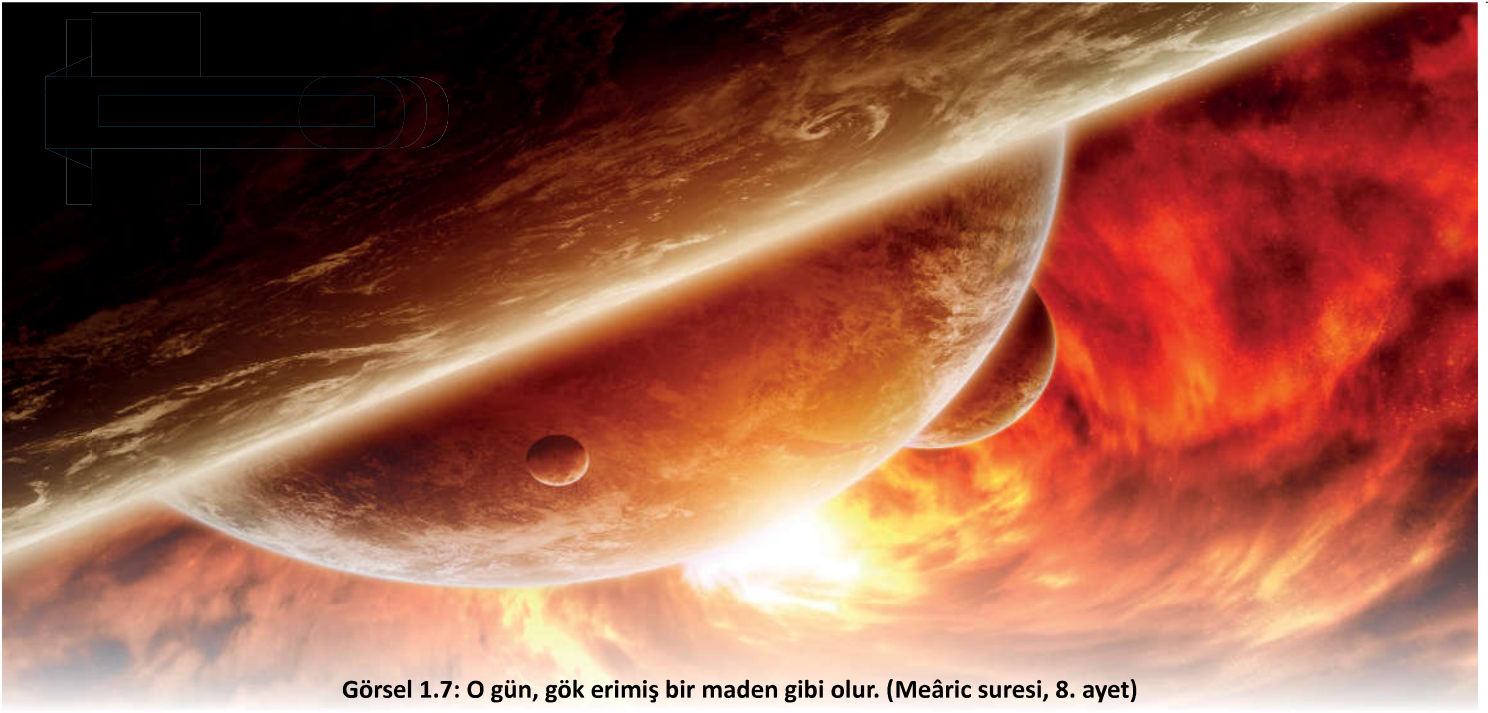
Görsel 1.7: O gün, gök erimiş bir maden gibi olur. (Meâric suresi, 8. ayet)