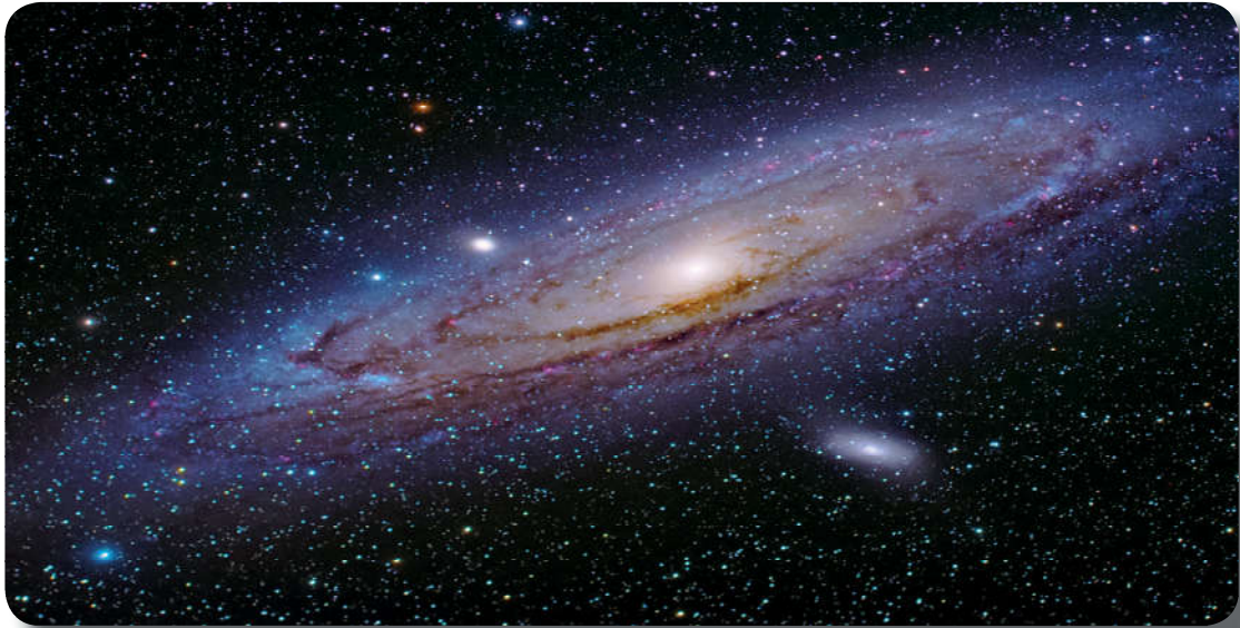
Görsel 1.2: Göklerde ve yerde ne varsa Allah'ındır (c.c.).

Hayatı anlamlandırmada ahiret inancının önemi ile ilgili bir kompozisyon yazınız.