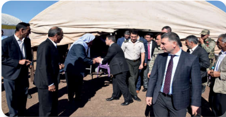
Görsel 1.13: Taziyede bulunmak dinî bir görevdir.

(Mustafa Tatçı, Yunus Emre Divanı, C 2, s. 254)