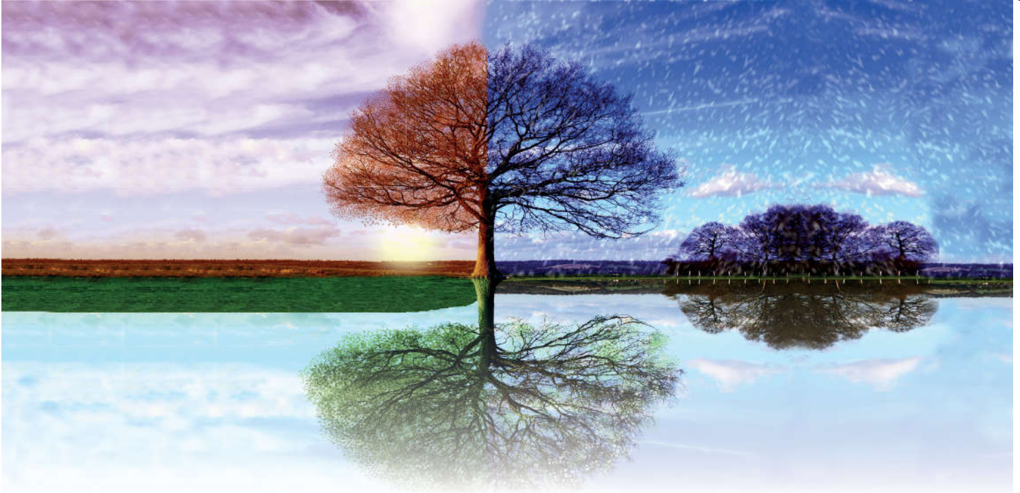
Görsel 1.4: Dünyada yapılanların karşılığı ahirette verilecektir.