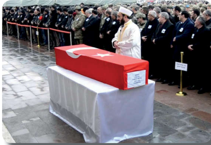
Görsel 1.12: Cenaze namazına katılmak, dinî ve insanî bir görevdir.