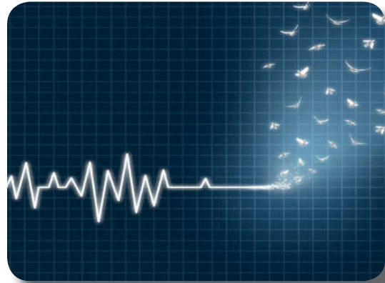
Görsel 1.5: Ölüm bir yok oluş değildir.

Anne karnındaki bir bebeğe dünya hayatını ve bu hayatın gerçekliğini anlatma imkânınız olsaydı nasıl anlatırdınız? Düşüncelerinizi arkadaşlarınızla paylaşınız.