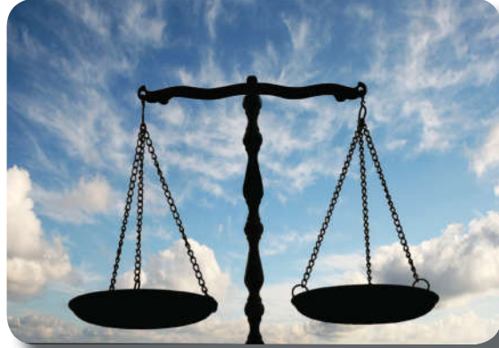
Görsel 1.11: O gün, kimseye haksızlık yapılmaz.

Mahşerde toplanan insanlar muhakeme edilecekler, insanlara sualler sorulacak ve herkes dünyada yaptıklarının hesabını verecektir. Dünya hayatında yapılanlar, görevli melekler tarafından amel defterlerine kaydedilir. 45 Hesap günü herkesin defteri kendisine teslim edilecektir. " ... 'Oku kitabını! Bugün hesap görücü olarak sana nefsin yeter.' denilecektir. " 46 İnsanlar, bu defterleri okuyacaklar ve yaptıklarını inkâr edemeyeceklerdir.