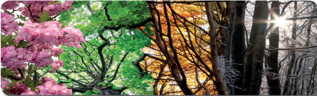
Görsel 1.10: Mevsimlerin değişiminde akıl sahipleri için ibretler vardır.