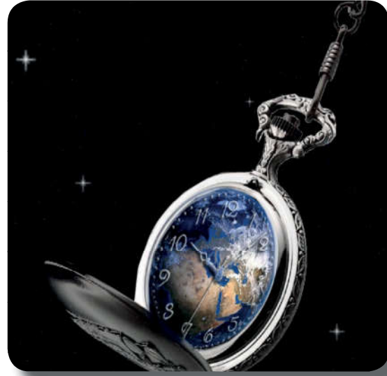
Görsel 1.8: Kıyamet vaktinin bilgisi Allah (c.c.) katındadır.

Kıyamet, İsrâfil (a.s.)* isimli meleğin, sûra üflemesi ile başlayacaktır. O gün Allah Teala’nın diledikleri hariç göklerde ve yerde olan her şey dehşetle sarsılacaktır. Evrendeki tüm düzen bozulacak, gökyüzü maden gibi eriyecek, yeryüzü ve dağlar birbirine çarpılıp kum yığınına dönecek, güneş dürülüp yıldızlar dökülecek, her şey ölecek ve yıkılıp yok olacaktır. 32 Bu konuyla ilgili Kur’an-ı Kerim’de şöyle buyrulmuştur: “ Sûra üflenince Allah’ın diledikleri müstesna olmak üzere göklerde ve yerde ne varsa hepsi ölecektir. Sonra ona bir daha üflenince bir de ne göresin, onlar ayağa kalkmış bakıyorlar. ” 33 Hz. Peygamber de kıyametle ilgili olarak şöyle buyurmuştur: “ Zamanı gelmedikçe kıyamet kopmaz... ” 34