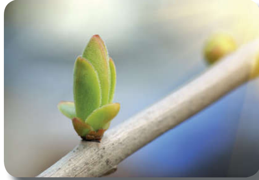
Görsel 1.9: Allah (c.c.) hayat verendir.

Ölünce toprağa defnedilen ve çürüyüp toprak olan insanlar, tekrar oradan çıkarılacak ve mahşerde toplanacaktır. 39 Ayet ve hadislerde haşir gününün zor ve dehşetli bir gün olacağı, bütün sırların ortaya döküleceği 40 , kimsenin kimseye faydasının ve zararının olmayacağı bildirilir. Allah Teala'nın huzuruna varmayı yalanlayanların zarara uğrayacağı 41 ve bazılarının kör, dilsiz ve sağır olarak haşredilecekleri 42 belirtilmiştir.