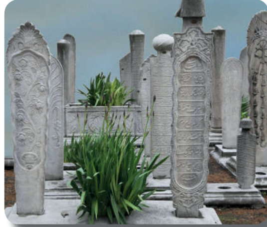
Görsel 1.6: Ölüm hayatın bir gerçeğidir.