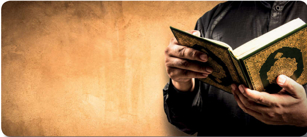
Görsel 3.2: Kur’an-ı Kerim hidayet kaynağıdır.

Doğru yolda olma veya doğru yoldan sapma, insanın özgür iradesine bırakılmıştır. Allah Teala; nimetine şükredeni, buyruklarını yerine getireni, hata yaptığında tövbe edeni, adaletli ve dürüst olanı, birliğini tanıyıp ihlasla O’na kul olanı hidayete kavuşturur. 10 “Ey iman edenler! Allah’tan korkun, O’na yaklaşmaya vesile arayın ve O’nun yolunda cihat edin ki kurtuluřa eresiniz.” 11 ayeti gereğince kiři, hidayete kavuřmak için sebepleri arařtırmalı ve onlara sımsıkı sarılmalıdır. Yüce Allah’ın rahmeti ve lütfu gereğı seçtiğı peygamberler ve gönderdiğı vahiyler, kulların hidayetine bir vesiledir. Hz. Muhammed (s.a.v.), son nefesine kadar hidayet yolunda insanlara rehberlik etmiş ve bir insanın hidayetine vesile olmanın ne kadar değerli olduğunu bildirmiştir. Bu sebeple insana düşen görev; Allah’ın (c.c.) gönderdiğı kitaba ve elçisi Hz. Muhammed’e (s.a.v.) uymak, Allah’tan (c.c.) hidayet istemektir.