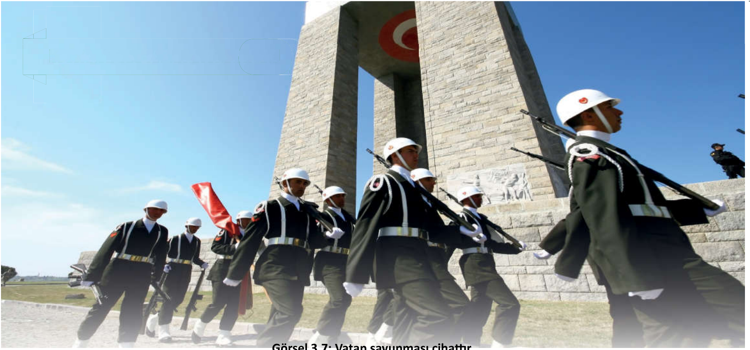
Görsel 3.7: Vatan savunması cihatıdır.

me uğrama sebebiyle cihat için izin verildi. Şüphe yok ki Allah'ın onlara yardım etmeye gücü yeter.” 51 ayetiyle cihada izin vermiştir. Bununla birlikte Yüce Allah “Sizinle savaşanlarla siz de Allah yolunda savaşın, fakat aşırılığa sapmayın; Allah aşırılığa sapanları sevmez.” 52 buyurarak haksız saldırıyı ve başlanmış bir savaşta aşırı gitmeyi, gereksiz kan dökmeyi ve çevreye zarar vermeyi de yasaklamıştır. 53