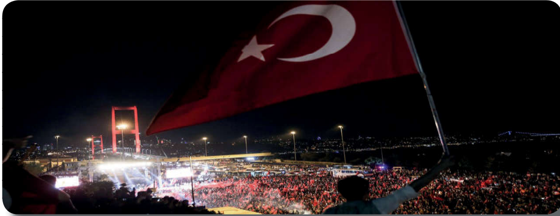
Görsel 3.6: Vatan sevgisi imandandır.

Kur'an ve sünnet bütünlüğü içinde bakıldığında cihadı, sadece silahlı mücadele (kıtal-mukatele) ile sınırlandırmak doğru değildir. Cihatla ilgili bu sınırlandırma, kavramın çoğu zaman terörle bağlantı kurularak istismar edilmesine neden olmaktadır. Hz. Muhammed (s.a.v.), "Ey İnsanlar, düşmanla savaşmak üzere karşı karşıya gelmeyi temenni etmeyiniz. Allah'tan, sizi savaştan korumasını isteyiniz. Düşmanla karşılaşınca da sabrediniz." 44 buyurmuş ve savaşmayı en son çare olarak göstermiştir. Buna rağmen Müslümanlar; dinini, vatanını, canını düşmanlara karşı korumak zorunda kalabilirler. Nitekim Çanakkale Savaşı, Kurtuluş Savaşı ve 15 Temmuz darbe girişimi gibi vatan savunmasının gerektiği zamanlar yaşanmıştır. İşte böyle zamanlarda iç ve dış düşmanlarla mücadele etmek her vatandaşın görevidir ve bağımsızlık açısından oldukça önemlidir. Yüce Allah'a ve Müslümanlara savaş açanlara karşı mal ve can ile mücadele edilmesi, Kur'an-ı Kerim'de "Kolay da olsa zor da olsa sefere çıkın ve mallarınızla canlarınızla Allah yolunda cihad edin..." 45 ayetiyle bildirilmiştir.