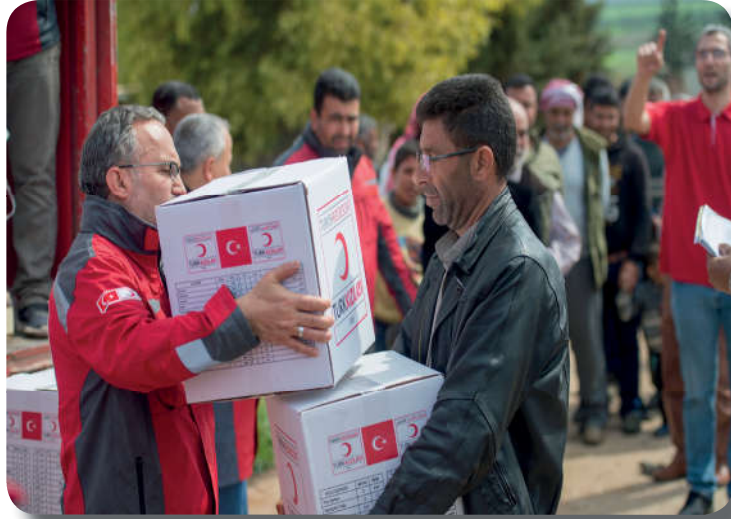
Görsel 3.8: Yapılan her güzel iş salih ameldir.

Allah Teala “İman edip salih ameller işleyenlere gelince insanların en hayırlısı onlardır... Allah kendilerinden hoşnut olmuş, onlar da Allah'tan hoşnut olmuşlardır...” 60 buyurarak insanları iyilik yapmaya yönlendirmiştir. Salih amel işleyenlerden Kur'an-ı Kerim'de övgüyle bahsetmiştir. Aynı zamanda Kur'an-ı Kerim'de salih amel işleyenlere güzel bir hayat vadedilmekte ve şöyle buyurulmaktadır: “Erkek olsun kadın olsun, kim mü'min olarak dünya ve ahirete yararlı işler yaparsa kesinlikle ona güzel bir hayat yaşatacağız ve böylelerinin ecirlerini de muhakkak surette yapmış olduklarının daha güzeliyle vereceğiz.” 61 Allah (c.c.), ayrıca iman edip salih amel işleyenlerin kalplerine sevgi koyacağını da belirtmektedir. 62 Hz. Peygamber “Üç şey ölüyü mezara kadar takip eder; ikisi geri döner, biri kalır. Ailesi, malı ve ameli onu takip eder. Ailesi ve malı geri döner, ameli kalır.” 63 hadisiyle salih amelin önemini vurgulamıştır. Kur'an-ı Kerim'de, “İman edip dünya ve ahiret için yararlı işler yapanlara ne mutlu! Varılacak güzel yurt onlar içindir.” 64 buyrulurken salih amel işleyenlerin mükâfatlandırılacağı belirtilmiştir.