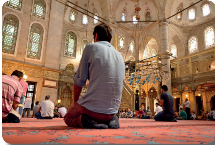
Görsel 3.4: Takva, kişinin ibadetlerinde Allah'a (c.c.) karşı saygılı olmasıdır.

Takva, kişinin ibadet ve davranışlarında Allah'a (c.c.) karşı saygılı olması ve O'na itaatsizlik etmekten sakınmasıdır. Takva sahibi kişi, günahlardan kaçınır ve büründüğü takva elbisesi 31 ile her türlü kötülükten korunmaya çalışır. Yüce Allah'ın "Onlar bilmiyorlar mı ki, Allah onların gizli tuttuklarını da bilir, açığa vurduklarını da." 32 ilahî