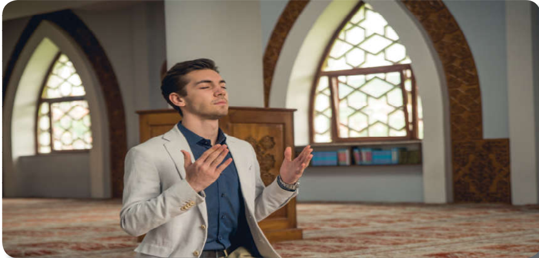
Görsel 3.3: Dua ihlas ve samimiyetle yapılmalıdır.

İbadetlerin kabul olmasının ilk şartı, onları Yüce Allah'ın emrettiği şekilde yerine getirmek, ikinci şartı ise ihlas ve samimiyetle yapmaktır. Her türlü gösteriş, menfaat ve çıkar beklentisinden uzak; yalnızca Allah'ın (c.c.) rızasını gözeterek yapılan ibadetler, Allah (c.c.) katında daha değerlidir. Yüce Allah “... öyleyse içten bir inanç ve bağlılık göstererek sadece Allah'a ibadet et...” 20 buyurmuş, insanların ibadetlerde ihlas ve samimiyetle kendisine yönelmesini emretmiştir. Hz. Muhammed (s.a.v.), ibadetlerin samimi ve ihlaslı bir şekilde yapılmasının önemini “Şüphesiz ki, Allah sizin suretlerinize ve mallarınıza bakmaz; lâkin kalplerinize ve amellerinize bakar.” 21 hadisiyle belirtmiştir. Allah Teala, “Ey iman edenler! İçtenlikle ve kararlılık içinde Allah'a tövbe edin. Umulur ki Rabbiniz kötülüklerinizi örter ve sizi altından ırmaklar akan cennetlerine koyar...” 22 ayetiyle içtenlikle yapılan tövbelerin kabul olunacağını bildirmiştir. Aynı şekilde ihlas ve samimiyetle yapılan dualar, Allah (c.c.) katında makbul olunan dualardandır.