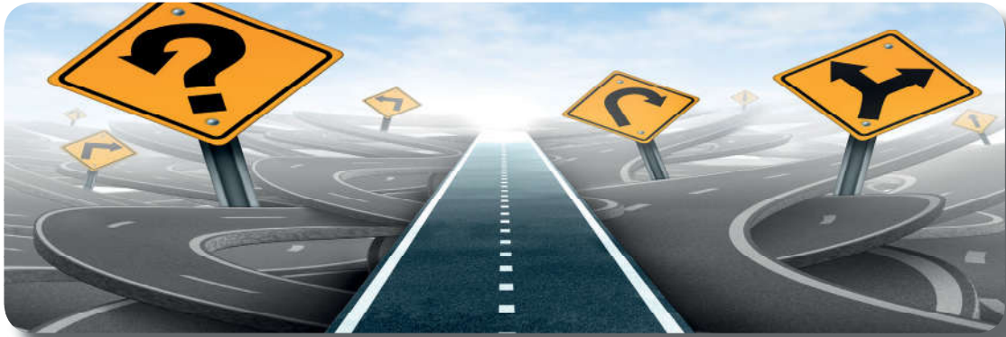
Görsel 3.5: Emrolunduğun gibi dosdoğru ol. (Hûd suresi, 112. ayet)

Yukarıdaki sözlük anlamı verilen kavramlara örnekler bularak defterinize not ediniz.