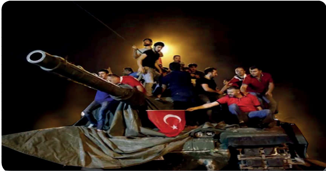
Görsel 4.7: 15 Temmuz darbe girişimi din istismarının bir sonucudur.

Yukarıdaki ayette verilmek istenen mesajı defterinize not ediniz.