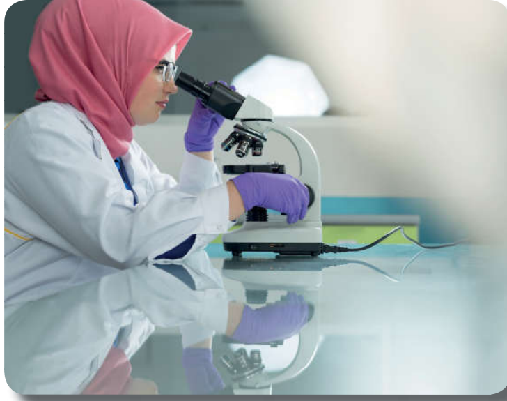
Görsel 4.3: İslam bilimi teşvik eder.

İslam'a göre din, bilimi teşvik eder ve bilimin ilerlemesini destekler. İnananlar Kur'an-ı Kerim'de geçen "Düşünmez misiniz?" 23 , "Akletmez misiniz?" 24 gibi ifadelerle ilme yönlendirilmiştir. Bilim dünyasında önemli bir yere sahip olan İbn-i Sina, İbn-i Heysem, Ali Kuşçu, Hezârfen Ahmed Çelebi gibi Müslüman âlimlerin ortaya koyduğu çalışmalar, İslam dininin insanları bilime teşvik ettiğinin bir göstergesidir.