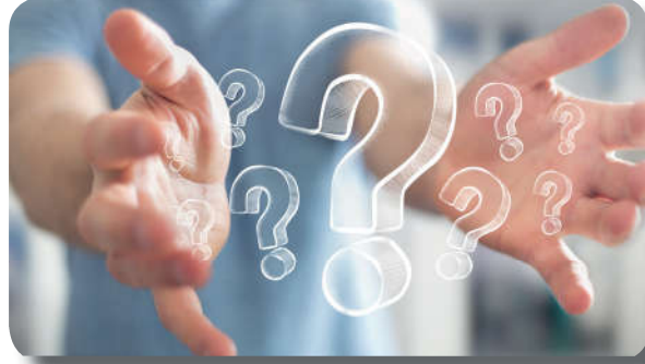
Görsel 4.5: İslam dininde iman kesin bilgiye dayanır.

kesin olarak bilinmeyeceği gibi yokluğu da kesin olarak bilinemez. 27 Antik Yunan'da insanın, her şeyin ölçütü olduğu ileri sürülmüştür. Bu görüş, algı veya inançlardan bağımsız sabit bir gerçeklik olmadığı biçimindeki bir ana fikre dayanır. Bu durum gerçeğin bilgisinin mümkün olmadığı şeklinde bir sonuç doğurmuştur.