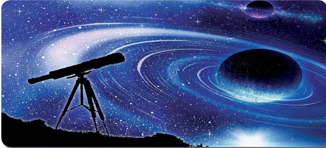
Görsel 4.2: Bu eşsiz kainat Allah'ın (c.c.) varlığının delilidir.

Varlığı gerçekçi bir biçimde anlama ve açıklama çabası, tarih boyunca devam etmiştir. Bu çaba bazen peygamberlerin rehberliğine uygun olarak gerçekleşmiş bazen de insanlar çeşitli sebeplerle inanç konusunda değişik yol ve tutumlar benimsemişlerdir. Eski dönemlerde var olan inançla ilgili felsefi yaklaşımlara teknolojinin geliştiği, iletişim olanaklarının arttığı günümüzde de yenileri eklenmiştir. İnanç konusundaki felsefi yaklaşımlar, bilişim çağının imkânlarıyla küresel boyutta yayılma alanı bulmuştur. Bu felsefi yaklaşımlardan bazıları teizm, deizm, materyalizm, pozitivizm, sekülerizm, agnostisizm ve ateizmdir.