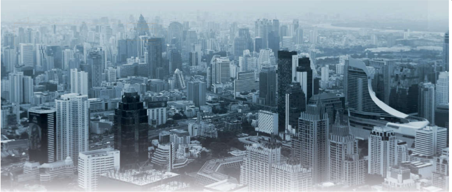
Görsel 4.4: Sekülerizm insanı dünyaya bağımlı hâle getirir.

Sekülerizm, geçmişte toplumsal açıdan önemli bir dönem yaşandığını kabul etmekle beraber günümüzde dinin, dünya ve günlük hayat için anlamını yitirdiğini savunur. Siyasi ve felsefi temelleri olan sekülerizm, insana belli bir yaşam biçimi ve eylem anlayışı sunmayı amaçlar. Sunduğu bu yaşam tarzı ve eylem anlayışında Tanrı ve ölüm sonrası hayat düşüncesine başvurmaz. Dini ve dinî duyguyu, hiçbir işe karıştırmadığı için dinden bağımsız ve uzak bir hareketi temsil eder. Böylelikle sadece akla dayanarak sağlam, tutarlı ve insanı mutluluğa götürecek bir ahlak geliştirilebileceğini varsayar. 25