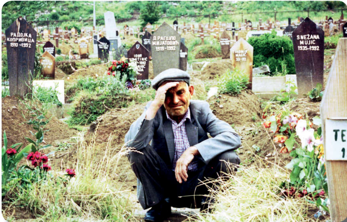
Görsel 4.8: Srebrenitsa Katliamı İslamofobinin bir sonucudur.

İslam’ın terörle ilişkilendirilmemesi için Kuran-ı Kerim’in bu konuda neler söylediğinin dikkatli bir şekilde incelenmesi gerekir. Müslümanların da üzerlerine düşen görevleri yerine getirerek dinini asıl kaynaklarından öğrenmesi, bunu hayatında uygulanması ve her anlamda bilgili ve donanımlı hâle gelmesi gerekir.