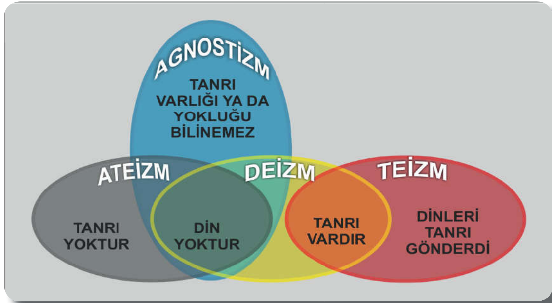
Tablo 4.1: Felsefi yaklaşımların din ve Tanrı görüşleri.

Ateistlerin iddia ettiği gibi evrende yaratıcı olmadığı düşüncesi İslam inancına aykırıdır. Yüce Allah “ Acaba onlar bir yaratıcı bulunmadan mı yaratıldılar, yoksa yaratıcı kendileri midir? Yoksa gökleri ve yeri onlar mı yaratmışlar? Hayır hayır! Onlar bir türlü idrak edip inanmıyorlar. Yoksa rabbinin hazineleri onların yanında mıdır? Yoksa her şeye egemen olan onlar mı? Yoksa onların, üstüne çıkıp gizli şeyleri dinleyecekleri bir merdivenleri mi var? Eğer öyleyse, içlerinden dinleyen biri açık bir kanıt getirsin. ” 35 ayetleriyle kendi yaratılışını unutanlara bir yaratıcının olduğunu hatırlatmakta, Allah’ın (c.c.) varlığını inkar edenlerden de delil istenmektedir.