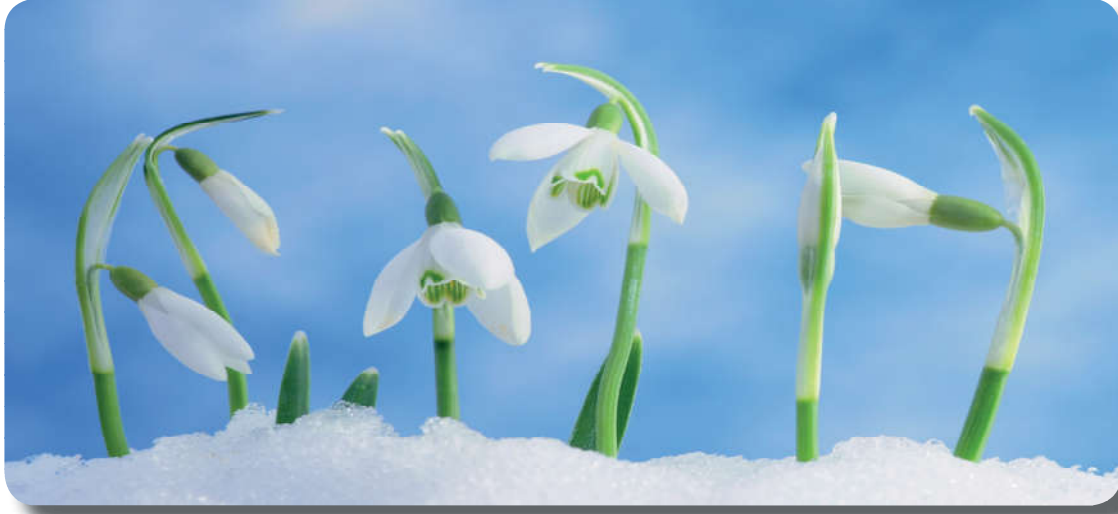
Görsel 4.6: Yüce Allah'ın rahmetinden ümit kesilmez.

Karamsar dünya görüşüne dayanan bu felsefede anlamsızlık, saçmalık, kötümserlik, umutsuzluk hâkimdir. Nihilizm; varlığı, hayatı ve insanı tek taraflı değerlendiren, kötülükler odaklanarak bunalımlı bir ruh yapısıyla her zaman kötülükleri göz önünde tutan bir bakış açıdır. Nihilizm; evrenin anlamsız ve amaçsız olduğunu, hayatın ve insanın değeri ya da anlamı olmadığını, kendisi için yaşanmaya değer hiçbir şeyin bulunmadığını savunur. Nihilizmin ateizmle ortak noktası, Tanrı inancını yok saymasıdır. 36