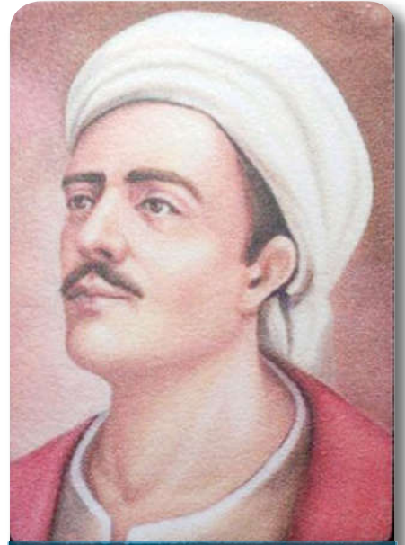
12.2.14. Yunus Emre (temsili)

Yunus'un mürşidi Tapduk Emre'dir. Ancak tarikatının ne olduğu net değildir. Eski Anadolu Türkçesinin oluşumunda çok önemli rol oynayan ilk Türk şairidir. Onun kullandığı kelimeler ve ifade kalıpları, bunlara yüklediği anlamlar ve mecazlar Türkçenin edebî bir dil hâline gelmesi yolunda büyük bir aşama olmuştur. Esasen Yunus'u diğer mutasavvif şairlerden ayıran özelliği de budur. Anadolu'nun birçok yerinde hatta Azerbaycan'da Yunus Emre'nin kabri kabul edilen makamı vardır. Bu durum, Yunus Emre'nin Anadolu'da ve Türklerin yaşadığı coğrafyalarda ne kadar büyük bir iz bıraktığının açık kanıtı sayılır.