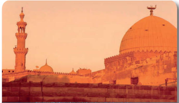
12.2.8. İmam Şafî türbesi-Mısır