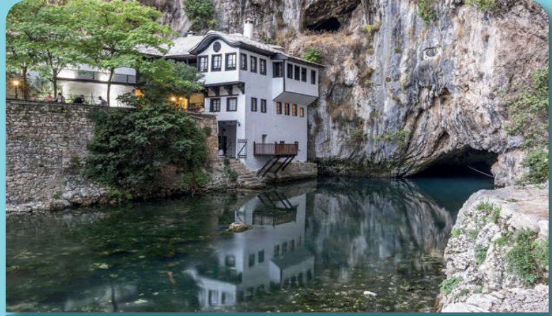
12.2.15. Sarı Saltuk (Blagay) tekkesi-Bosna Hersek

Sarı Saltuk, beylerin ve kralların kendisinin mezarına sahip çıkmak isteyeceklerini söyleyerek her isteyene verilmek üzere birer tabut hazırlamalarını vasiyet etmiştir. Sarı Saltuk'un mezarını kendi ülkesinde bulundurmak isteyen beylere verilmek üzere on bir tabut hazırlanır. Çevredeki beylerden ve krallardan her isteyene bir tabut verilir. Tabutu alan,