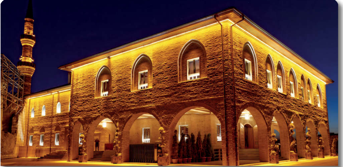
12.2.16. Hacı Bayram Camii-Ankara

Hacı Bayram-ı Veli döneminde, Anadolu'da siyasi karışıklıkların olduğu bir ortamda, Hacı Bayram-ı Veli'nin müderrisliği bırakıp tasavvuf yolunu seçerek halkı ahlaki yönden diriltmeye çalışması Osmanlı Devletinin yeniden ihyasını sağlamıştır. Hacı Bayram-ı Veli, Orta Asya'dan gelen Türk göçerlerin yerleşik hayata geçmesini sağlamış, böylece Anadolu Türk birliğinin tesisinde ve Anadolu'nun iktisadi bakımdan gelişip kalkınmasında önemli bir rolün sahibi olmuştur.