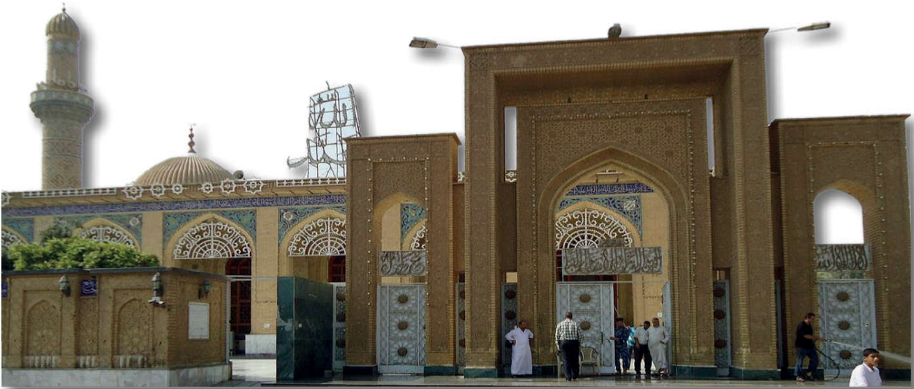
12.2.5. Ebu Hanife'nin Türbesi-Bağdat

Hanife'nin asıl hocası, Hammâd b. Ebu Süleyman'dır. 16 Ebu Hanife itikadi konulardaki görüşleri ile dönemin genel kabul gören ekollerinin dışında bir bakış açısı getirmiştir. Ehl-i sünnet inanç sisteminin oluşmasına zemin hazırlayan âlimlerdendir. Özellikle Basra'da Allah'ın (c.c.) sıfatları, kader meselesi, büyük günah işleyeninin durumu ve tekfir gibi ilk dönemin belli başlı akaid meseleleri üzerinde farklı görüşlere mensup âlimlerle tartışmalara girmiştir. İslam ümmetinin çoğunluğu tarafından benimsenen ilkeleri ortaya koymuş ve bunları güçlü delillerle savunmuştur. 17 Onun görüşleri daha sonra öğrencileri İmam Muhammed ve İmam Ebu Yusuf vasıtasıyla yayılma imkânı bulmuş, eserleri de öğrencileri vasıtasıyla günümüze kadar gelmiştir. Ebu Hanife'nin günümüze ulaşan beş eseri Türkçe olarak yayımlanmıştır. Hanefilik mezhebi günümüzde genellikle Türkiye, Orta Asya, Kuzey Afrika, Pakistan, Mısır ve Balkanlar'da yaygındır.