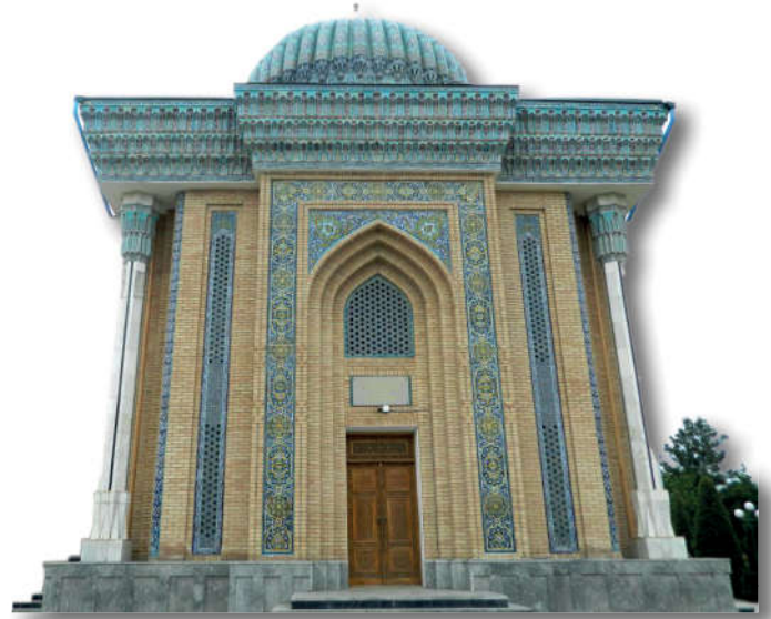
12.2.6. İmam Maturidi'nin türbesi-Semerkant

Maturidi'nin Kitabü't-Tevhid ve Te'vilât adlı eserleri incelendiğinde, kendinden önceki kelamcıların tartışmadığı önemli problemleri tartıştığı, daha önce kullanılmayan akli, nakli, semantik temellendirmelerde bulunduğu ve kelama gerçek anlamda bir bilim hüviyeti kazandırdığı açıkça görülecektir. Onun kelim ilmine kazandırdığı en önemli yeniliklerden biri, bilgi kuramıdır. Bilgi kuramı Maturidi ile birlikte kelamın müstakil bir konusu olmuştur.