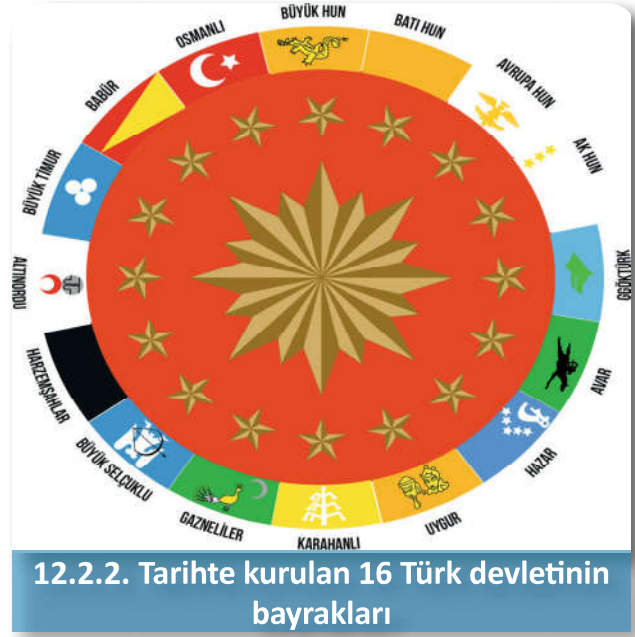
12.2.2. Tarihte kurulan 16 Türk devletinin bayrakları

Selçuklu İmparatorluğunun kurulması ve Türklerin İslam dünyasına hâkim olmalarıyla Selçuklular, İslam âleminde hem yeniden birliği sağladılar hem de İslam medeniyetine bilgi ve yetenekleriyle birçok katkıda bulundular. Yeni Selçuklu Devleti'nin kuruluşunun neticelerinden biri Anadolu'nun fethi ve Türkleşmesidir. Bu hadise Malazgirt Zaferi'nin ardından büyük bir Türk nüfusunun Anadolu'ya göçmesi ile mümkün olmuştur. Anadolu'ya ikinci bir göç dalgası da Moğol İstilasını nedeniyle yaşanmıştır. Bu göçlerle başlayan süreç neticesinde Selçuklular zamanında Anadolu, Osmanlılar zamanında ise Anadolu'nun bir uzantısı olan Balkanlar'da İslamiyet yayıldı. 8