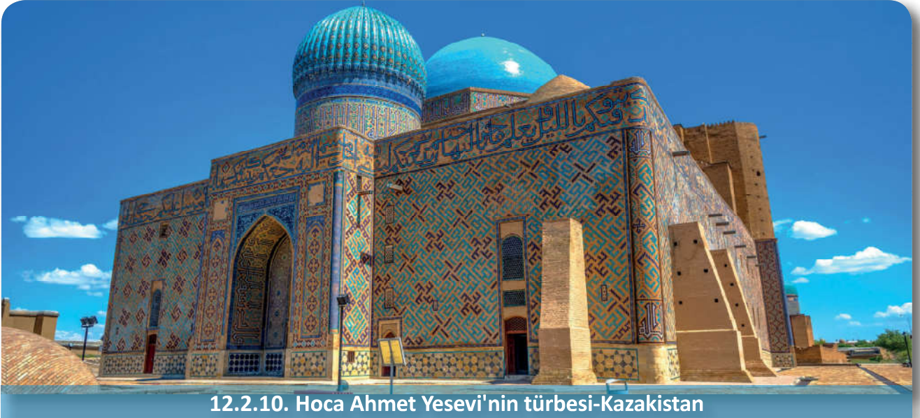
12.2.10. Hoca Ahmet Yesevi'nin türbesi-Kazakistan

Doğum tarihi kesin olarak bilinmemekle birlikte muhtemelen 1093 yılında bugünkü Kazakistan sınırları içinde yer alan Türkistan'ın Yesi kasabasında doğmuş ve 1166 yılında vefat etmiştir. 29