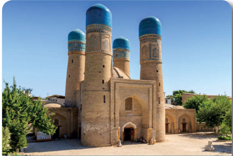
12.2.1. Orta Asya'da inşa edilen ilk camilerden Buhara Camii

Türklerin arasında İslamlaşma, din adamlarının çabalarıyla hız kazanmıştır. Özellikle Talas Savaşı'nda Türkler, Çinlilere karşı, Müslümanların yanında yer alarak sadece savaşın değil, Türk-Müslüman münasebetlerinin de seyrini değiştirdiler. Artık bu savaştan sonra Türklerin yüzü İslam dünyasına dönmüştü. Abbasi halifeleri yavaş yavaş Türklerin daha kabiliyetli olanlarını devletlerinin müdafaasında görevlendirmeye başladılar. 5 Abbasilerin takip ettiği doğru siyaset neticesinde Halife el-Me'mun ve el-Mu'tasım zamanlarında Maverâünnehir sakinlerinin tamamı Müslüman oldu.