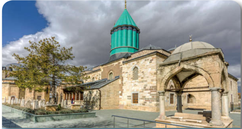
12.2.11. Mevlana'nın türbesi-Konya

Onun hakkındaki çalışmalar ve eserlerinden yapılan tercümelemler vasıtasıyla görüşleri bugün dünyada geniş bir kitleyi etkilemiştir. 34 Divan-ı Kebir, Mesnevi, Fîhi Mâ fîh gibi eserleri vardır. Bu eserler İslam dünyasında olduğu gibi Batı'da pek çok ülkede de en çok okunan kitaplardandır.