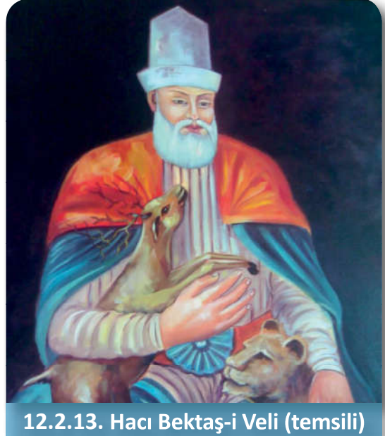
12.2.13. Hacı Bektaş-i Veli (temsili)

Osmanlıların en önemli askerî gücü olan Yeniçerilerin tamamı, sınır boylarında cihat eden Türkmenlerin ise büyük kısmı Bektaşî'dir. Yani yeniçeriler hem asker hem de mürittir. Hatta