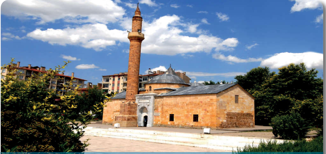
12.2.12. Ahi Evran türbesi-Kırşehir

Ahilik teşkilatının Anadolu'daki kurucularından olan Ahi Evran bu teşkilatın piri kabul edilen, âlim ve mutasavvıf bir şahsiyettir. Asya'dan gelerek Anadolu'da birçok şehri dolaştıktan sonra Kırşehir'e yerleşti ve ahilik teşkilatının yayılmasında önemli hizmetler yaptı. Özellikle 1. Alâeddin Keykubad'ın büyük destek ve yardımıyla, bir taraftan tasavvufi düşünceye ve fütüvvet ilkelerine bağlı kalarak tekke ve zaviyelerde şeyh mürit ilişkilerini düzenlemiştir. Diğer taraftan iş yerlerinde usta, kalfa ve çırak münasebetlerini ve buna bağlı olarak iktisadi hayatı düzenleyen ahiliğin Anadolu'da kurulup gelişmesinde büyük rolü olmuştur. 36