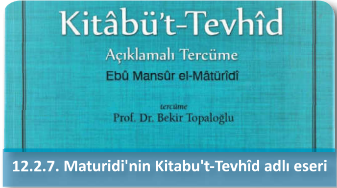
12.2.7. Maturidi'nin Kitabu't-Tevhîd adlı eseri

Malikilik mezhebinin ve Hanefilik mezhebinin olduğu bir dönemde yaşadığı için her iki mezhebi derinlemesine inceleme fırsatı oldu. Bu iki mezhebin kendine uygun olmayan görüşleri üzerinden kendi adıyla anılacak Şafîlik mezhebinin teşekkülünü sağladı. Şafî'nin düşünce yapısında genel olarak vahiy, özel olarak Resulullah'ın sünneti merkezî bir konuma sahiptir. Güçlü bir muhakemeye sahip olması Şafî'ye dil ve bağlamla ilgili verileri mantıklı bir tutarlılık içinde ve maharetle işlemesine imkân vermiştir. 27 İmam Şafî birçok eser yazmıştır. Bunlardan en tanınmışısı Kitabu'l-Umm adlı eseridir.