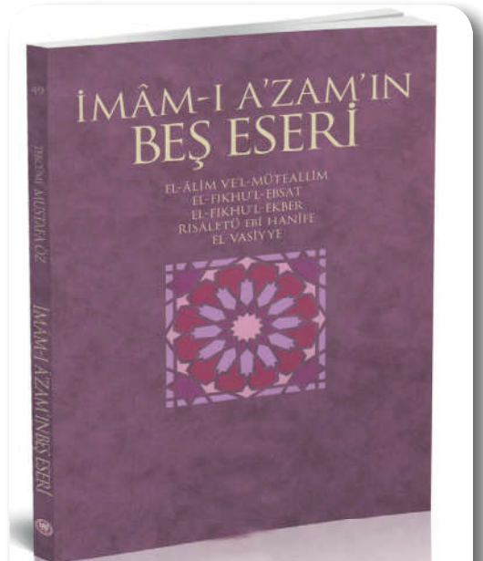
12.2.4. İmam-ı Azam'ın Türkçe'ye çevirilmiş olan eseri

Ebu Hanife küçük yaşlardan itibaren çok iyi bir eğitim görmüştür. Devrinin seçkin âlimlerinin pek çoğu ile görüşme ve onlardan ilim öğrenme imkânı bulan Ebu