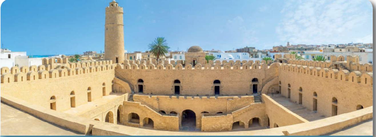
12.2.3. Bir ribat-Tunus

Tasavvuf, 7. yüzyıldan itibaren her an Allah'la (c.c.) birlikte olma ve gafletten sakınma amacıyla ortaya çıkan bir akımdır. 10 Tasavvuf ehli olan derviş, sufi ve erenler İslamiyet'in Horosan, Anadolu ve Balkanlar'da yayılmasında, özellikle sayıca çok kalabalık bir kesimi oluşturan göçebe Türklerin İslamlaşmasında etkili rol oynamışlardır.