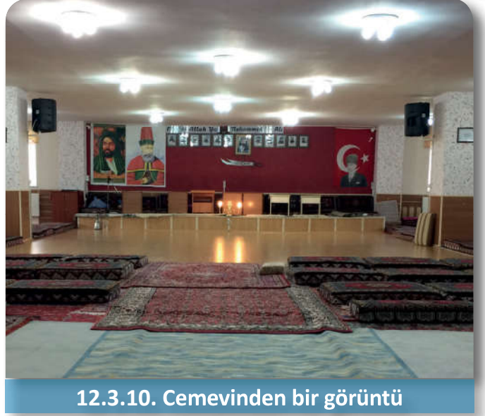
12.3.10. Cemevinden bir görüntü

Cemin sonunda dede şöyle dua eder: “Bism-i Şâh! Allah, Allah. Oturan, duran, kovsuz, gıybetsiz Hakk Muhammed Ali deyip evine varan tüm canların Yüce Allah dildeki dileğine, gönüldeki muradına vasil eyleye. Gerçeğe hû...”