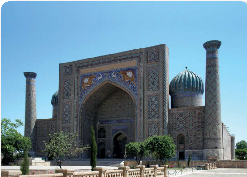
12.3.7. Bahaüddin Nakşibend Türbesi-Buhara