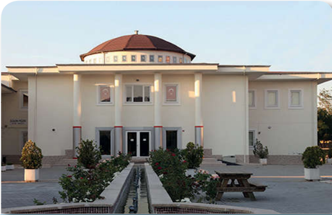
12.3.9. Bursa Nilüfer Belediyesi Cemevi

Yılın belli zamanlarında yapılan önemli cemler bulunmaktadır. Dardan indirme cemi, Musahiplik cemi, Düşkünlükten kaldırma cemi ve Abdal Musa cemi gibi farklı zamanlarda yapılan cem türlerinin hepsi, cem evinde ve dedenin huzurunda gerçekleştirilir.