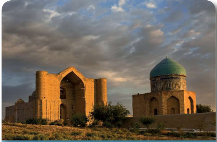
12.3.3. Ahmet Yesevi Türbesi-Türkistan

Yesevilik'te insan Allah (c.c.) ilişkisinin önemli bir yeri vardır. Buna göre insan her an Yüce Allah'a (c.c.) yaklaşma gayreti içinde olmalıdır. Allah'tan (c.c.) korkmalı fakat hiçbir zaman O'ndan ümidini kesme-