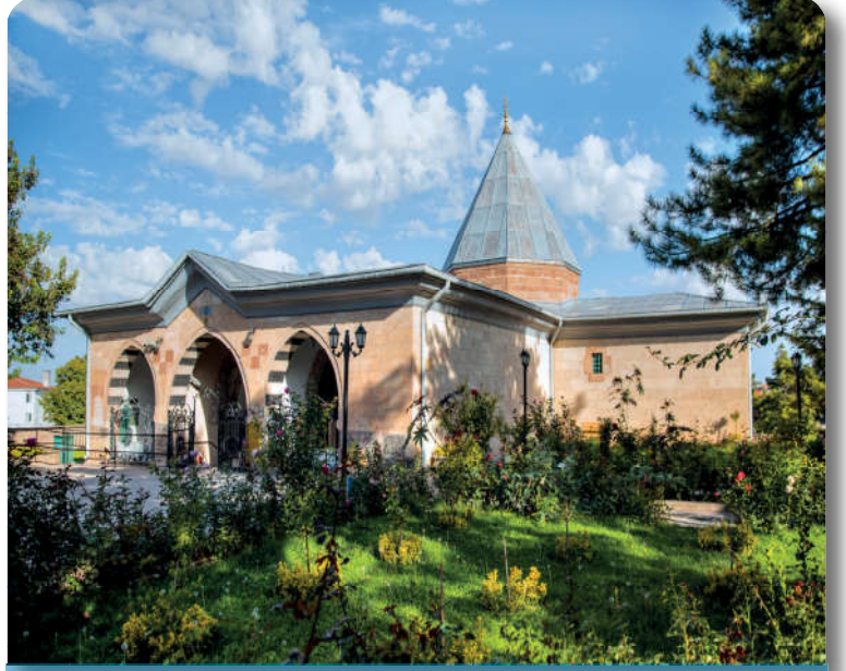
12.3.8. Hacı Bektaş Veli Türbesi-Nevşehir

Hacı Bektaş-ı Veli; ünlü mutasavvıf Hoca Ahmet Yesevi'nin düşüncelerinden etkilenmiş, Orta Asya'dan Anadolu'ya gelerek insanlara ahlaki davranışlarıyla örnek olmuştur. Tasavvufun inceliklerini yaşatarak insanların İslam dinini benimsemelerine yardımcı olmuştur. Hacı Bektaş-ı Veli dört kapı (Şeriat, Tarikat, Marifer ve Hakikat) kırk makam adını verdiği öğretisinde imanın şartlarına, ilim öğrenmeye; namaz, oruç, hac, zekât, abdest, gusül vb. ibadetleri yerine getirmeye vurgu yapmıştır. 41