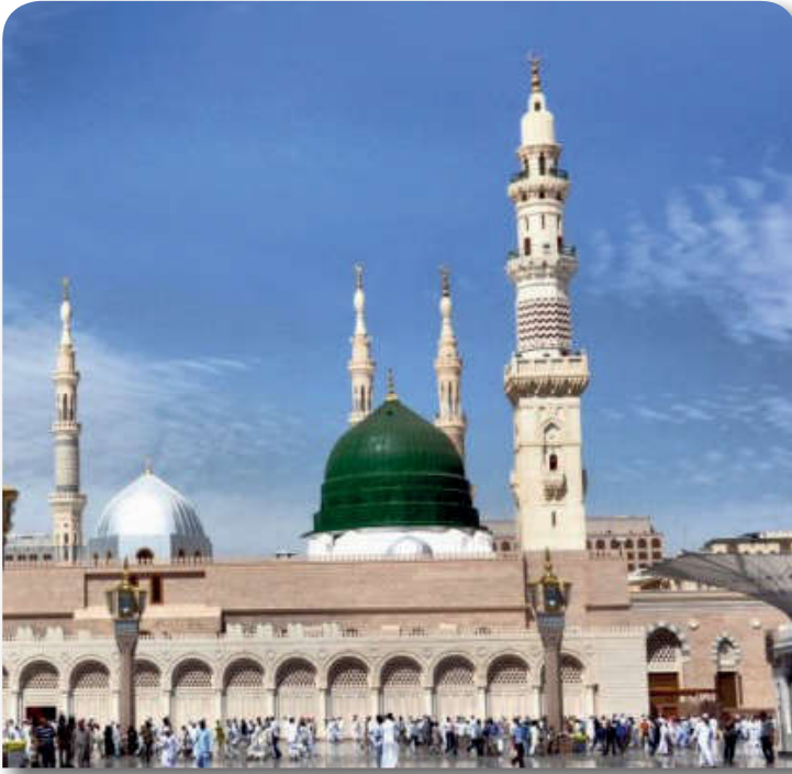
12.3.1. Mescid-i Nebi

Tasavvufun önem verdiği konular arasında nefis terbiyesi, Allah'ı (c.c.) zikir, dünyaya gereğinden fazla değer vermeme gibi ilkeler öne çıkar.