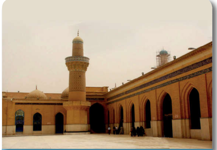
12.3.4. Abdülkadir Geylani Türbesi-Bağdat

Abdülkadir Geylani'nin temkinli ifadeleri, dini düşünce sınırları zorlamayan fikirleri kadar coşkulu zikir meclisleri de kalabalıkları cezbetmiş ve Endülüs'ten Malezya'ya kadar uzanan topraklarda yayılma imkanı bulmuştur. Tarikat pirinin zikir ve düşünceleri tasavvufi düşünceye sert tenkitler yönelten İbn Teymiye'nin bile eleştirilerine hedef olmamıştır. Bağdattaki türbesi çok meşhur ziyaret yerlerinden biridir. 31