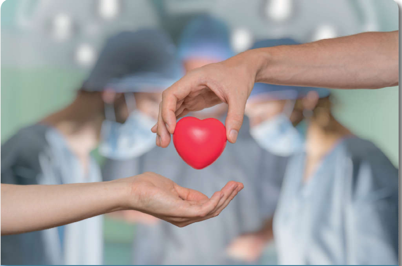
12.4.9. İslam âlimlerine göre ölüden kalp nakli yapılabilir

Kur'an ve sünnet, gerekli gördüğü bazı konularda ayrıntılı hükümler koymakla birlikte, her olay hakkında ayrıntıya inmeyip bütün dönemlerde ortaya çıkabilecek problemler için genel ilke ve kurallar bildirmekle yetinmiştir. Güncel bir mesele olması nedeniyle organ nakli hakkında klasik fıkıh kaynaklarında açık ifadelere rastlanmamaktadır. Günümüzde organ naklinin İslam prensipleriyle ve amaçlarıyla ilişkisini kurarken farklı açılardan incelenip araştırılması gerekmektedir. Ayrıca İslam, ölüye önem vermekle birlikte hayata ve insana daha çok önem vermiş, hayatı korumayı beş temel esastan biri saymıştır. Bu nedenle günümüz İslam bilginleri ve fetva kuruluşları, tedavi maksatlı organ naklinin bazı şartlarla caiz olduğunu açıklamışlardır.