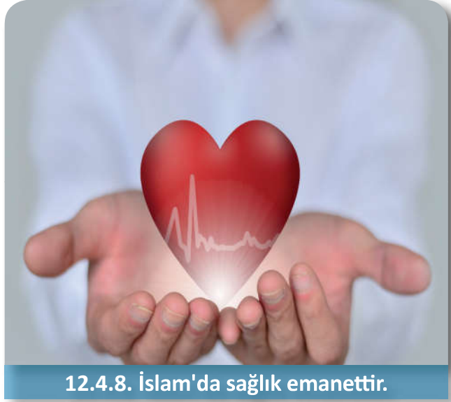
12.4.8. İslam'da sağlık emanettir.

Günümüzde tıp teknolojisi ve sağlık alanında büyük ilerlemeler kaydedilmiştir. Bu durum olumlu gelişmelerin yanında dinî, hukuki ve ahlaki yönlerden de birçok sorunları beraberinde getirmiştir. Sağlık gibi hastalığın da bir imtihan olarak var olduğu bilinciyle günümüz Müslümanları sağlıklarına Allah'ın (c.c.) razı olduğu yollardan kavuşmayı arzulamaktadır. Bu bağlamda otopsi, ötenazi, organ nakli, kan bağı, haram maddelerle tedavi ve intihar konuları son zamanlarda yoğun olarak tartışılmaktadır.