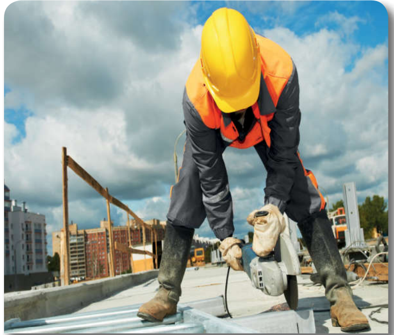
12.4.5. İşçi, sağlığını ve güvenliğini riske atmamalıdır.

İşçinin işveren üzerinde maddi hakları yanında birtakım manevi hakları da vardır. Hiçbir iş, işçinin hayatından ve sağlığından önemli olamaz. Bu bakımdan çalışma şartları insanın şeref