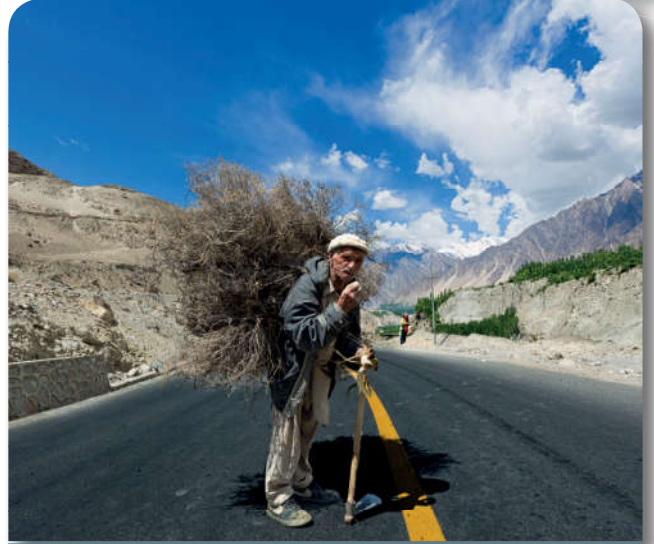
12.4.4. En hayırlı kazanç kişinin el emeğidir.

Allah Teâlâ, “İnsan için ancak çalıştığı vardır.” 9 buyurarak fakirliğin bir istismar aracı olarak kullanılmasını yasaklamıştır. Hz. Peygamber de, “Sizden birinizin sırtında odun küfesi taşıması dilenmesinden hayırlıdır.” 10 sözleriyle insanları alın teri dökerek rızkını temin etmeye yönlendirmiştir. Alın teri, kazancı bereketli kılar. Bunun yanında Allah Teâlâ, bazen varlığı ve yokluğu kulları için imtihan vesilesi kıldığını ve bu nedenle bazı kullarına dünya nimetlerini bol, bazılarına da az verdiğini bildirmektedir. 11 Fakat dünyada bolluk içinde yaşamak, mal ve servet sahibi olmak; Allah (c.c.) katında üstün tutulmanın bir göstergesi değildir. Bu konuda üstünlük en erdemli davranışı sergileyenindir.