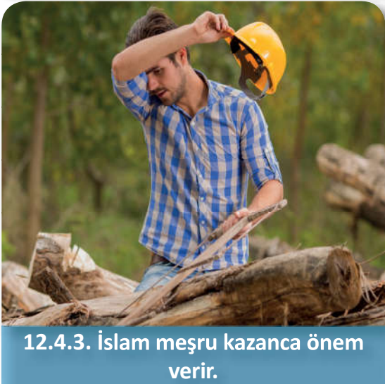
12.4.3. İslam meşru kazanca önem verir.

Bir kimsenin sahip olup üzerinde her türlü tasarrufta bulunabildiği şeylere mülk denir. Mülk sahibine ise malik denir. Mülkiyet, malike malın kendisinden yahut kirasından yararlanma, bu malı devrettiği takdirde karşılığını alma yetki ve hakkını verir. Mülkiyet insanın yaratılışına uygun olduğu gibi toplumda adalet ve dengeyi kurabilmek açısından da önemlidir. Bu nedenle İslam dini özel mülkiyeti kabul eder ve bu konuda emeğe öncelikli bir önem verir.