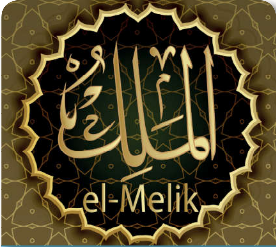
12.4.2. Allah'ın isimlerindedir

İnsanların tükenmek bilmeyen maddi ihtiyaçları dinî yaşantılarını nasıl etkilemektedir?