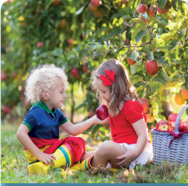
12.4.6. Helal gıda insan neslini korur.

İslam dininde bazı yiyeceklerin haram kılınmış olması çeşitli hikmetler ve amaçlarla açıklanabilir. Kullanın bu yasaklara itaat etme yükümlülükleri vardır. Yiyecekler konusundaki yasaklar en başta insanın beden ve ruh sağlığının (hayatın ve aklın) korunmasını amaçlamaktadır. Beden ve ruh sağlığına zararlı olduğu sabit olan maddelerin yenilip içilmesi dinen yasaklanmıştır. 24 Bundan dolayı zehirli ve uyuşturucu maddeler, sarhoşluk veren katı, sıvı ve uçucular insan sağlığı açısından tehlike arz etmesi nedeniyle dinen haram kabul edilmiştir. Genel ölçüt olarak da temiz ve faydalı olanların yenebileceği, zararlı ve pis olanların yasaklandığı genel olarak vurgulanmıştır. 25