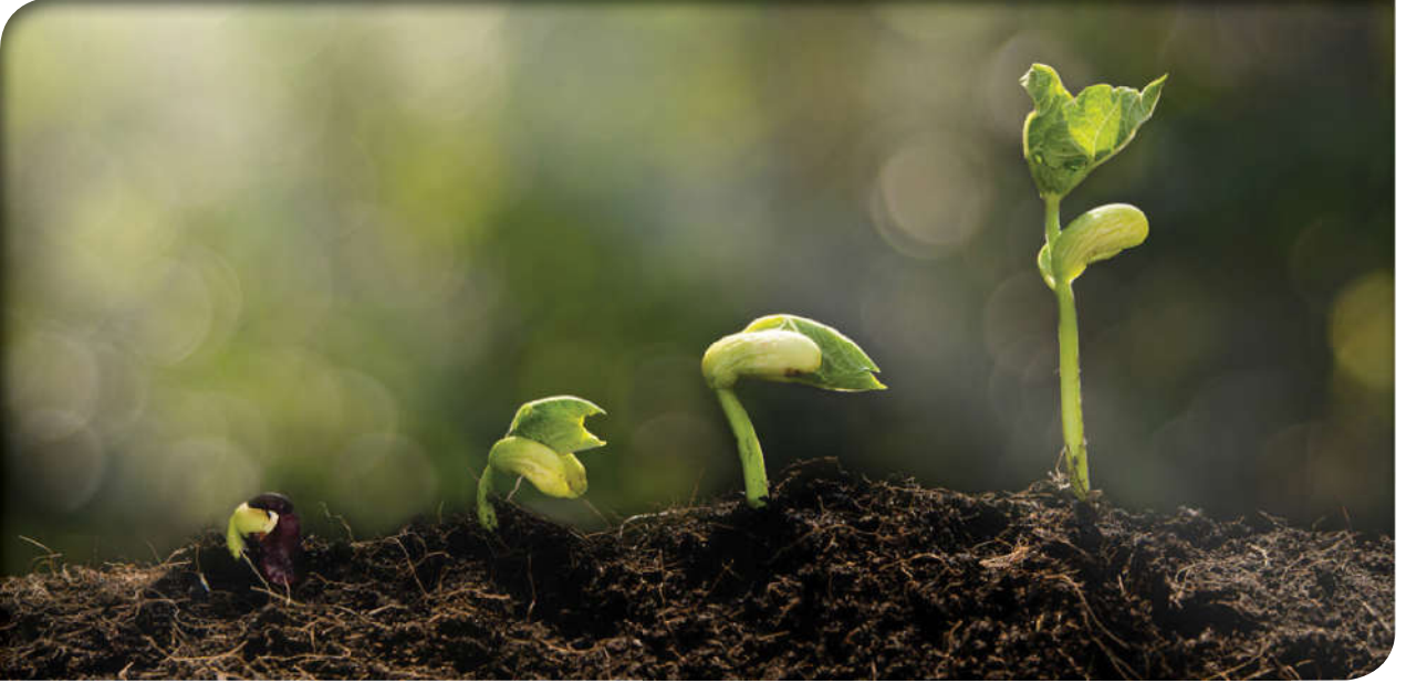
Fitrat, canlıların yaratılıştan sahip olduğu özelliklerdir.

Din duygusu, fitri (doğuştan gelen) bir özelliktir. İnanmak insanın doğuştan beraberinde getirdiği bir duygudur. İnsanın maddi, bedensel ihtiyaçları olduğu gibi ruhunun da ihtiyaçları vardır. İnsan ruhunun bu dünyada yalnız ve sahipsiz olmadığını bilmesi ve sığınılacak yüce varlığı bulması çok önemlidir. Bu yüzden insan her zaman ve her yerde yüce, kudretli ve ulu bir varlığa sığınma, ona güvenme ve ondan yardım dileme ihtiyacını hissetmiştir. Tarihin her döneminde din, insanın sığınma ve güvenme ihtiyacına karşı Allah'ın (c.c.) kullarına sunmuş olduğu bir ikramdır. Din aynı zamanda insanın anlam arayışına ışık tutar ve sorularına cevap verir.