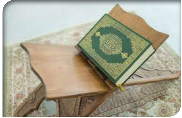
Tüm ilahi kitaplar tevhid inancını vurgulamıştır.

Hız. Âdem'den (a.s.) Hız. Muhammed'e (s.a.v.) kadar bütün peygamberler İslam peygamberleridir. 4 Çünkü bütün peygamberler insanları tevhid inancına çağırılmışlardır. Bu inancın temelinde Allah'ın (c.c.) tek olduğu, eşi, benzeri ve ortağı olmadığı gerçeği vardır. Allah'ın (c.c.) varlığı, birliği, peygamberlik ve ahiret inancı gibi temel inanç esasları İslam dininin değişmez ilkeleridir. Bütün peygamberler insanları bu gerçeği kabul etmeye çağırılmışlardır. Bundan dolayı Hız. Âdem'den (a.s.) Hız. Muhammed'e (s.a.v.) kadar bütün peygamberler, aynı dinin yani İslam dininin peygamberleridir.