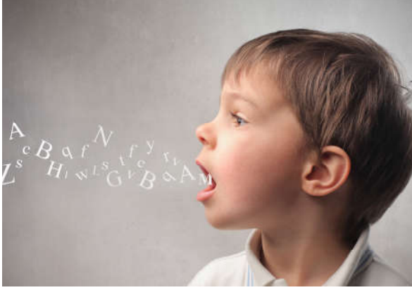
Görsel 1.13: Allah (c.c.) insanı üstün yeteneklerle donatmıştır.

Kur'an-ı Kerim'e göre Allah (c.c.) insanı en güzel şekilde yaratmış, ona doğru yolu göstermiş ve sorumluluk yüklemiştir.