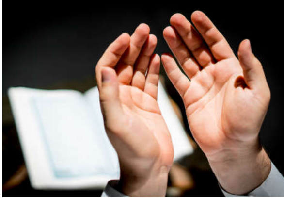
Görsel 1.19: Tövbe işlenen günahları terk etmektir.

Kur'an-ı Kerim'e göre ibadet etmek insanın yaratılış amaçları arasında yer alır. Yüce Allah “Ben cinleri ve insanları ancak bana ibadet etsinler diye yarattım.” 61 buyurarak kullarından kendisine ibadet etmelerini istemiştir. İbadet Allah'ın (c.c.) razı olacağı işlerin başında gelir. İbadetin hedefi Allah'ın (c.c.) rızasını kazanmak olmalıdır. İbadetlerde gösteriş yapmak ve dünyevi çıkarlar elde etmek gibi bir amaç güdülmemelidir.