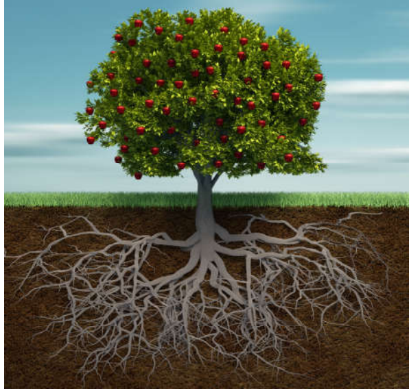
Görsel 1.1: Kur'an-ı Kerim Allah (c.c.) inancını meyve veren bir ağaca benzetir.

Düşünceden uygulamaya aktarılmayan bir inanç meyvesiz bir ağaca benzer. Allah'a (c.c.) inanmanın meyve vermesi, imanın insan hayatında kendisini göstermesi demektir. Allah (c.c.) inancı insanların kalplerine yerleşip kuvvetlenince onların davranışlarını etkiler. İnanan insanlar Allah'a (c.c.) karşı kulluk görevlerini yerine getirmeye çalıştıkları gibi insanlık için de daima faydalı olmaya gayret ederler. 3