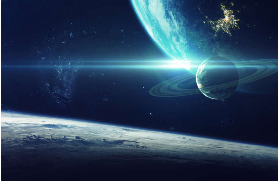
Görsel 1.21:Kâinat ilahi delillerle doludur.

Rûm suresi Mekke Döneminde inmiştir. 60 ayettir. Adını ikinci ayette geçen Rûm kelimesinden almıştır. Surede ağırlıklı olarak ahiret inancının önemi, Allah'ın (c.c.) sınırsız kudretine işaret eden deliller, Allah'ın (c.c.) birliği ve şirk inancının çürütülmesi ile ilgili konular yer alır.