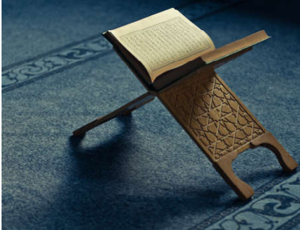
Görsel 1.14: Kur'an-ı Kerim insanı doğru yola ulaştırır.

İnsanın yaşaması için gerekli olan tüm unsurlar Yüce Allah tarafından ona verilmiştir. O daha üstün özelliklerle donatılmıştır. Bu özellikler sayesinde insan diğer varlıklardan daha ayrıcalıklı bir konumdadır. Bu durum Kur'an-ı Kerim'de “And olsun biz insanoğluna şan, şeref ve nimetler verdik; onları karada ve denizde taşıdık, kendilerine güzel güzel rızıklar verdik ve onları yarattıklarımızın çoğundan üstün kıldık.” 33 ifadeleriyle dile getirilir.