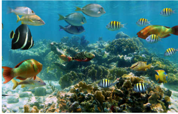
Görsel 1.7: Denizlerde ölçülü bir denge hâkimdir.