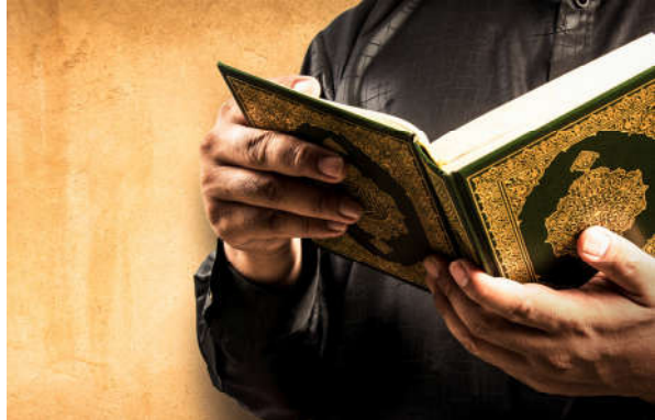
Görsel 1.20: Kur’an okumak ibadettir.

Kur’an-ı Kerim insanları doğru yola iletmek için indirilmiş bir kitaptır. Günümüze kadar hiç değişmeden gelen Allah (c.c.) kelamıdır. Bu nedenle sözlerin en güzeli olarak kabul edilir. Kur’an okumak ve okunurken onu dinlemek Müslümanlara öğütlenmiştir. 70 Yüce Allah’ın emir ve yasaklarını içeren Kur’an-ı Kerim’i okumak bir ibadettir.