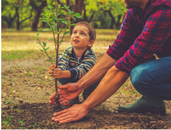
Görsel 1.2: Allah (c.c.) inancı insanı güzel işler yapmaya sevk eder.

(Mehmet Akif Ersoy, Safahat, Tevhid yahut Feryad, s. 21.)