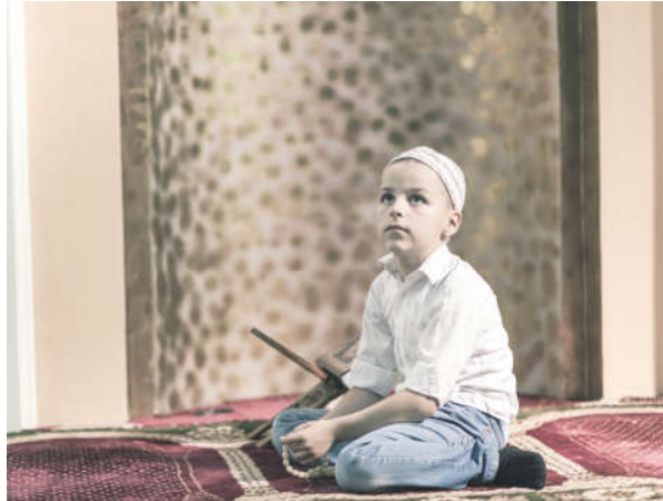
Görsel 1.8: İnsan doğasında Allah'ın (c.c.) varlığına inanma eğilimi vardır.