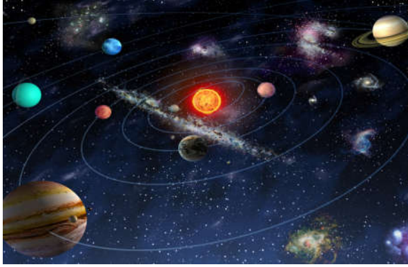
Görsel 1.5: Evrenin işleyişinde ölçü ve düzen vardır.

Kimi İslam bilginleri yeryüzünde bulunan nesne ve maddelerin Allah'ın (c.c.) varlığına ve birliğine açık bir delil olduğunu söyleyerek başka delil aramaya gerek olmadığını belirtmişlerdir. Kimileri de insanların kendi başlarına Allah'ın (c.c.) varlığını ve birliğini idrak edemeyeceklerini öne sürerek çeşitli deliller ortaya koymuşlardır.