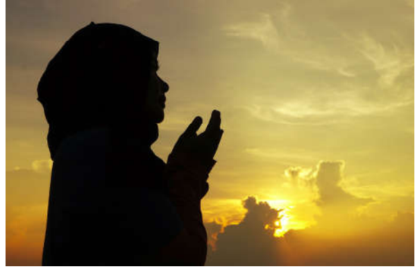
Görsel 1.16: İnsan Yaradanla irtibat kurabilir.

Yüce Allah'a inanan kişi O'na karşı derin bir sevgi besler. Bu nedenle O'na yaklaşmayı arzu eder. Yüce Allah da insanın kendisiyle irtibat kurmasını istemektedir. İnsanın Allah'la (c.c.) irtibatı dua, ibadet, tövbe ve Kur'an okuma gibi yollarla gerçekleşir.