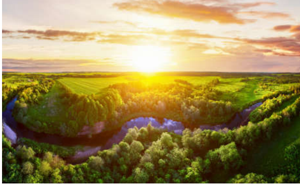
Görsel 1.4: Kur'an-ı Kerim akıl ve gözleme dayalı unsurlarla Allah'ın (c.c.) varlığını bulmaya yardımcı olur.