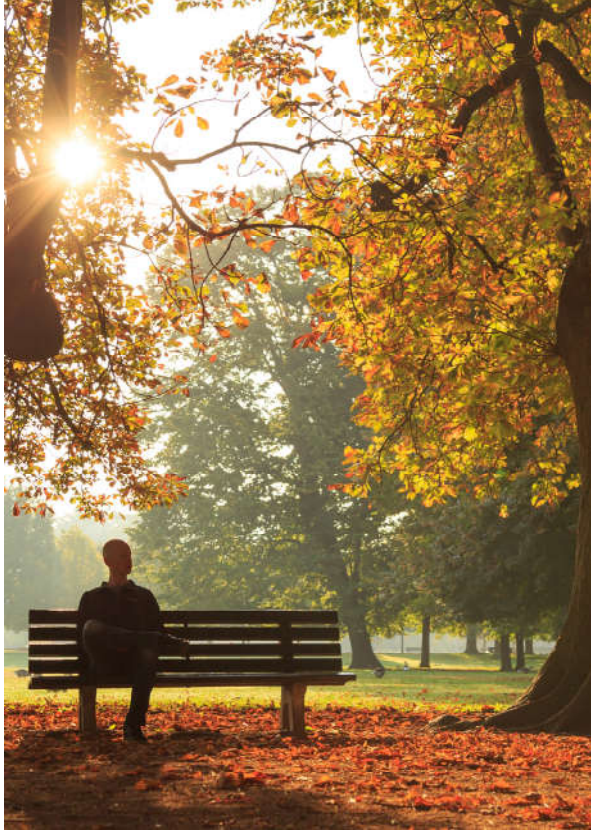
Görsel 1.3: Allah (c.c.) inancı insanın anlam arayışına cevaptır.