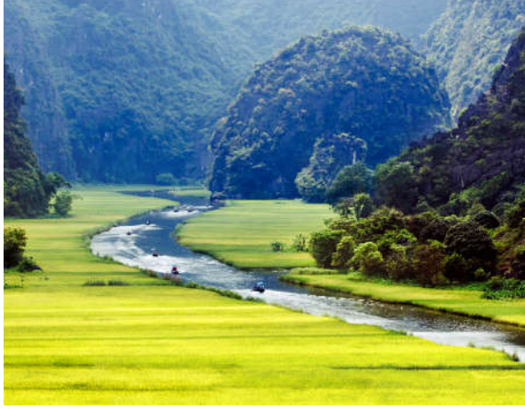
Görsel 1.9: Allah'ın (c.c.) isim ve sıfatları kâinata tecelli eder.

İnanan bir kimsenin Allah'a (c.c.) yönelip O'na gönülden bağlanması için zihin ve gönül dünyasının aydınlığa kavuşması gerekir. Bu da ancak Cenab-ı Hakk'ın güzel isimleri ve yüce sıfatları hakkında bilgi edinmekle gerçekleşir. 19 Yüce Allah bilinmeyi ve tanınmayı hak eden bir varlıktır. Allah'ın zatı (c.c.) zaman ve mekân boyutlarının ötesindedir. Hiçbir varlığa benzemez. Duyu organlarıyla kavranamaz. Bu nedenle insan O'nu ancak isim ve sıfatlarıyla tanıyabilir.