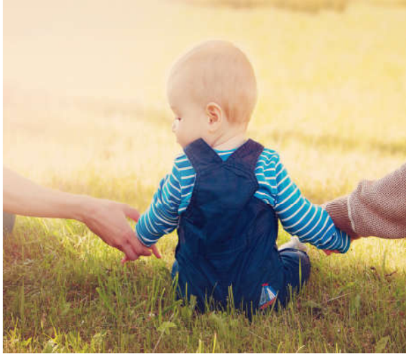
Görsel 1.12: Allah (c.c.) insanı evrende yalnız bırakmamıştır.

Bakara suresi 255. ayetini Kur'an-ı Kerim mealinden bularak defterinize yazınız.