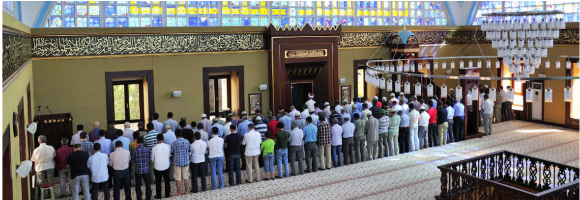
Görsel 1.18: İbadet, müminin Rabb’ine en yakın olduğu andır.

İbadet, Allah’a (c.c.) gönülden isteyerek yönelmek, tapmak, boyun eğmek ve itaat etmektir. Türkçemizde kullanılan kulluk etmek deyimini de aynı anlama gelir. 55 İnsan ibadet sayesinde gönülden Allah’a (c.c.) yönelir O’nunla irtibata geçer. Çünkü Allah (c.c.) insanın Rabbidir. İnsanı yaratmış ve onun hayatını düzenlemiştir. Kur’an-ı Kerim ibadeti bu çerçevede ele alarak şöyle buyurur: “ Ey insanlar! Sizi ve sizden öncekileri yaratan Rabbinize kulluk ediniz... ” 56