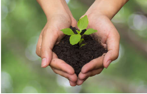
Görsel 1.15: İnsanın yücelmesi ve alçalması kendi elindedir.

İnsan üstün değerlere ulaşma konusunda Yüce Allah (c.c.) tarafından desteklenmiştir. Kur'an-ı Kerim'de yer alan “Şüphesiz biz ona doğru yolu gösterdik.” 37 ifadesi bunu gösterir. Allah (c.c.), insana bir yandan akıl ve duyu organlarıyla diğer yandan da vahiy bilgisiyle insana doğru yolu göstermiştir.