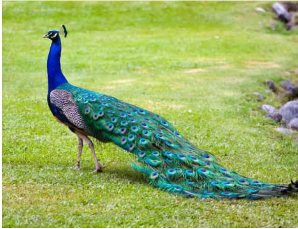
Görsel 1.10: Yüce Allah'ın yaratma sanatı akıllara hayranlık verir.

Allah (c.c.) yaratandır. Tekvin sıfatı Allah'ın yaratma özelliğine işaret eder. Mikroskopla görülebilen küçük varlıklardan gök cisimlerine kadar her şeyi sonsuz ilmi ve kudreti ile Yüce Allah yaratmıştır. Kur'an-ı Kerim'de “... O, her şeyi yaratmıştır...” 22 buyrulurak Allah'ın (c.c.) her şeyin yaratıcısı olduğu vurgulanmıştır.