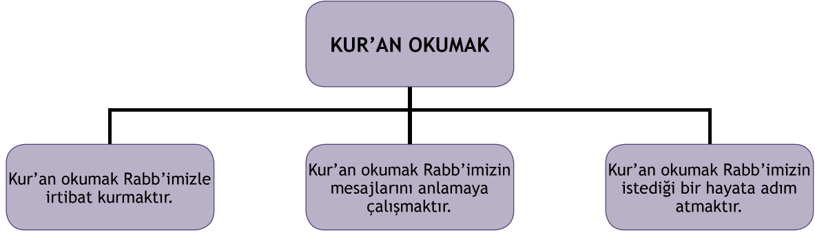
Şema 1.1: Kur'an okumanın Müslümanın hayatındaki yeri.

Kur'an okumanın farklı şekilleri vardır. Kur'an-ı Kerim anlamak, hayata geçirmek ve sevap kazanmak için okunur. Kur'an okumaya genel olarak kıraat denir. Hem okumak hem de emir ve yasaklarını hayata geçirmek amacıyla Kur'an okumaya ise tilavet denir. Tilavet ideal olan okuma biçimidir. Çünkü ilahi kitaplar sadece okunmak için değil, aynı zamanda hükümlerinin uygulanması için gönderilmiştir. 71