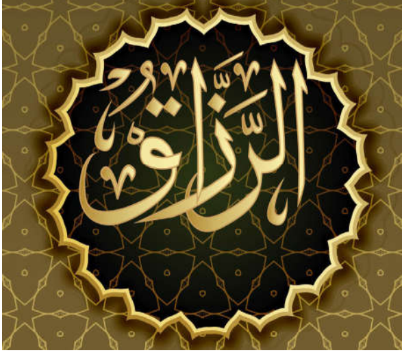
Görsel 1.11: Yüce Allah'ın "Rezzâk" ismini yansıtan bir hüsnü hat çalışması.