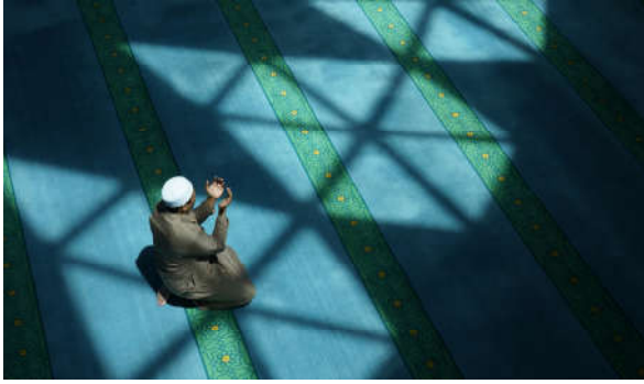
Görsel 1.17: Samimiyetle yapılan dualar yerini bulur.

(Müslim, Zikir, 73; Nesâî, İstiâze, 65.)