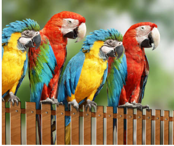
Görsel 1.6: Evrende hiçbir varlık kendiliğinden ortaya çıkmaz.

Evrendeki kusursuz düzen Allah'ın (c.c.) varlığına işaret ettiği gibi aynı zamanda O'nun birliğini de göstermektedir. İslam inancında Allah'ın (c.c.) varlığı yanında O'nun birliğine de inanmak gerekmektedir.