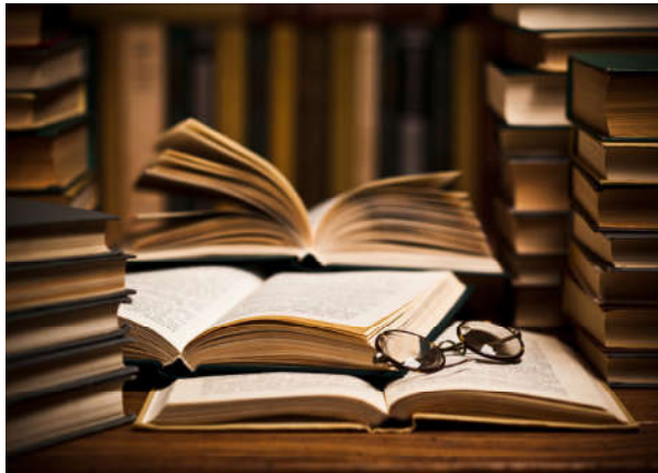
Grsel 2.6: Hiz. iře (r.a) gen alimlerden biriydi.

Hiz. Peygamberin eři Hiz. iře (r.a.), din ilimleri bizzat Hiz. Peygamber'den ğrenmiřti. Hiz. Peygamber ile aynı evi paylařtığı iin, onun ilminden gece gndz istifade etmiřtir. Hiz. Peygamber'in ders ve sohbetlerini dinlemiř, kavrayamadığı veya merak ettiđi her meseleyi de Hiz. Peygamber'e sorup ğrenmiřtir.