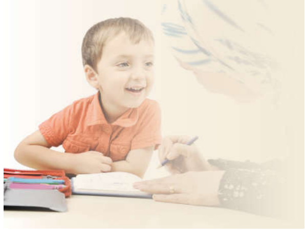
Görsel 2.8: Hz. Fatıma (r.a.) çocuklarla güzel bir iletişim kurmuş ve onları İslam ahlakıyla yetiştirmiştir (temsili görsel).

Örnek bir anne olan Fatıma (r.a.) çocukları üzerinde hassasiyetle titreyen, onları en güzel şekilde yetiştirmeye gayret eden biridir. O, çocuklarıyla ilişkilerinde sevgi, adalet, dürüstlük ve fedakârlığı dikkate almıştır. Çocuklarına şefkatle yaklaşmış ve onlara her konuda destek olmuştur. Babasından sevgi ve destekle beslenen Fatıma (r.a.) çocuklarına da aynı şekilde yaklaşmıştır. Hz. Fatıma (r.a.) çocuklarıyla oyun oynar, onlarla arkadaşlık yapar ve hakkı tavsiye ederdi. O, çocuklarıyla olan ilişkilerinde adaletle davranır ve çocukları arasında da ayırım yapmazdı. 36