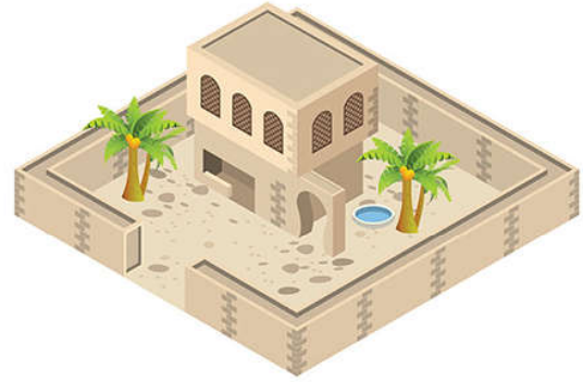
Görsel 2.5: Daru'l-Erkam, İslam'ın ilk yıllarında, Müslümanların karargahı olmuştur (temsili resim).

İslam'a ilk giren gençlerden biri olan Erkam b. Ebi'l-Erkam'ın (r.a.) Safa Tepesi'nin yanındaki evi, Hız. Peygamber ve diđer Müslümanlar için adeta bir karargah olmuştur. Erkam (r.a.) Hız. Peygamber'e sadakatle bağlanarak evini onun emrine verdi. Hız. Peygamber, İslam tarihinde "Daru'l-Erkâm" diye anılacak olan bu evi tebliđ faaliyeti için çok elverişli bularak, merkez haline getirmiştir. Hız. Peygamber, peygamberliğin ilk dönemlerinde insanları İslam'a bu evde davet etmiş, onlara ibadetleri burada öğretilmiştir. Müslümanlar, müşriklerin şerrinden korunmak için de bu evde gizlenmişlerdir. 22