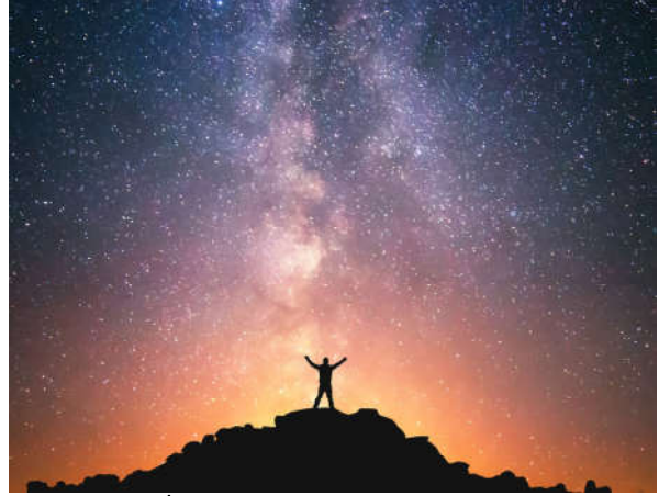
Görsel 2.2: İnsan, yüce bir varlığa inanma eğilimiyle dünyaya gelir.

Bu mu benim Rabb'im? demiş. O da batınca: Eğer Rabb'im beni hidayete erdirmeseydi; muhakkak sapanlar güruhundan olurum, demişti. Sonra güneşi doğarken görünce: Bu mu benim Rabb'im? Bu daha büyük demiş. Ama batınca: Ey kavmim, ben sizin şirk koştuğunuz şeylerden uzayım, demişti. Doğrusu ben, gerçekten yüzümü bir muvahhid olarak gökleri ve yeri yaratana çevirdim ve ben, müşriklerden değilim.” şeklinde Hz. İbrahim'in (a.s.) teffekürü anlatılır.