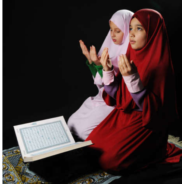
Görsel 2.7: Fatıma'nın (r.a.) eğitim yöntemleri arasında en dikkat çekici olanı, çocuklara küçük yaşlardan itibaren Allah sevgisini aşlamak, onlara namaz ve orucu öğretmek ve ibadete önem vermelerini sağlamaktır.

Hiz. Fatıma (r.a.), Hiz. Peygamber'in neslini devam ettiren tek evladıdır. Hiz. Fatıma (r.a.)