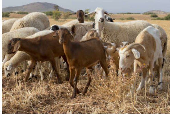
Görsel 2.3: Hz. Muhammed (s.a.v.) gençliğinde çobanlık yapmak suretiyle ailesine yardımcı olmuştur.

Hz. Muhammed'in (s.a.v.) doğmadan önce babası, altı yaşında iken annesi, sekiz yaşında iken de dedesi vefat etmiştir. Daha çok küçük yaşlardayken büyük acılar yaşayan Hz. Peygamber, dedesinin vasiyetiyle amcası Ebû Talib'in himayesinde yaşamaya başlamıştır. Ebû Talib ailesinin yakın ilgisine karşılık Hz. Peygamber ev işlerinde sorumluluk almış, kendisine verilen işleri hakkıyla yapmış, amcasına ve yengesine saygıda kusur etmemiştir. O, zaman zaman koyunlara çobanlık yapmak suretiyle evin dışındaki işlerde de ailesine yardımcı olmuştur. 11