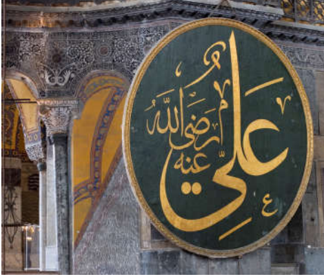
Görsel 2.4: Hat Sanatıyla yazılmış “Hz. Ali (r.a.)” (Ayasofya Camii)

Hz. Ali (r.a.), Hz. Peygamber’in amcası Ebû Talib’in en küçük oğludur. Mekke’de baş gösteren kıtlık üzerine Hz. Peygamber, onu himayesine almıştır. Hz. Ali (r.a.), aynı zamanda Hz. Muhammed’in (s.a.v.) peygamberliğine ilk iman edenlerdendir.