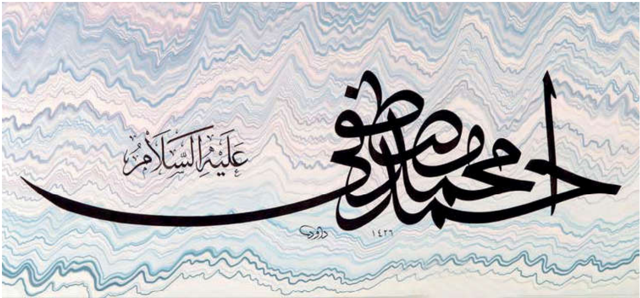
Görsel 55. Hz. Muhammed’in (s.a.v.) Ahmed, Muhammed ve Mustafa isimlerinin yazıldığı hat örneği