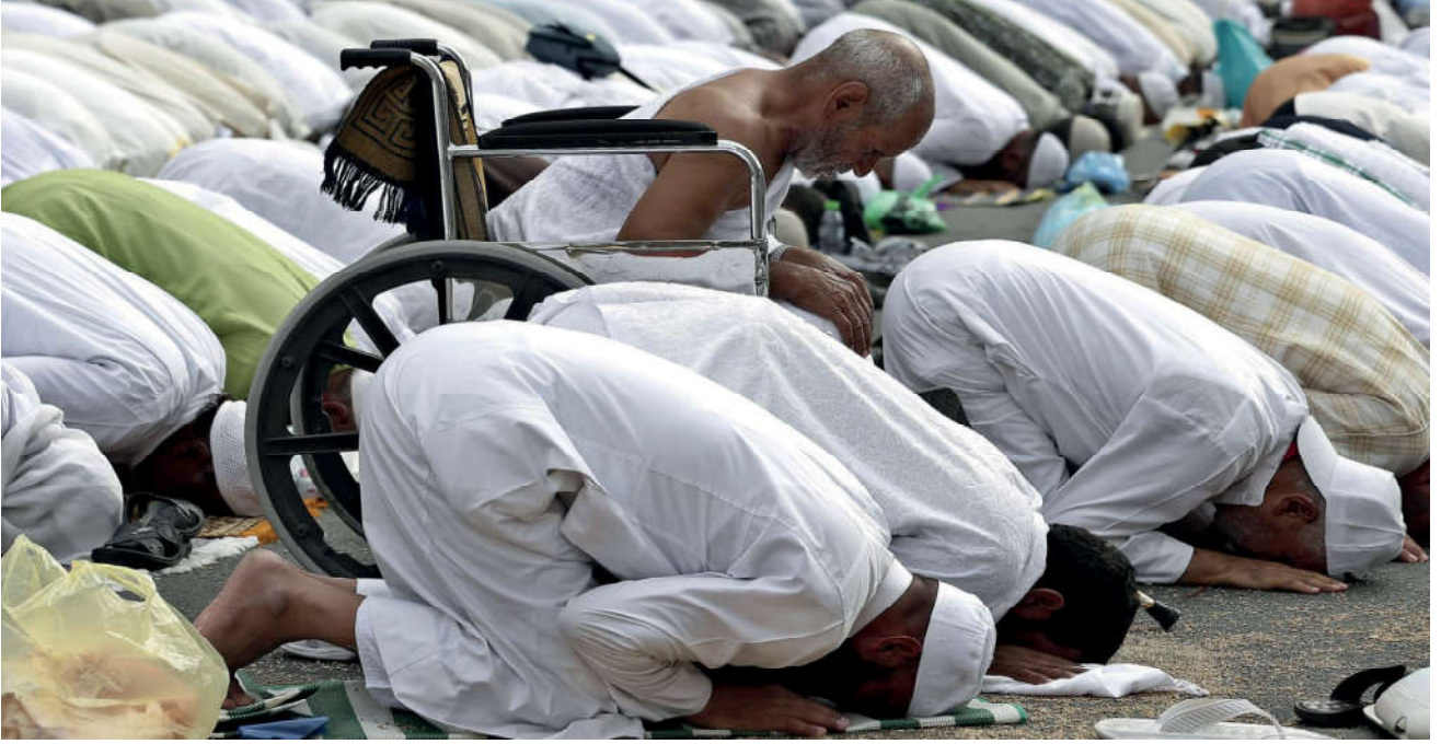
Görsel 46. Müslümanlar, Yüce Allah'ın huzurunda secdeye kapanarak kulluklarını ifade ederler.