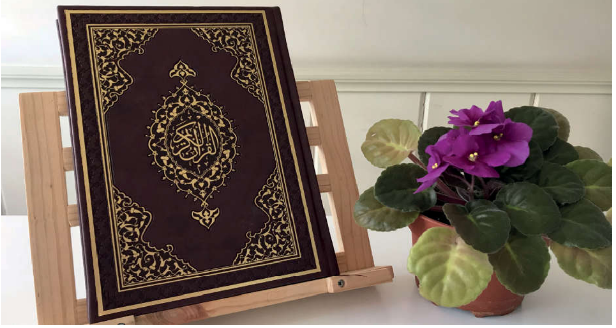
Görsel 51. Kur'an-ı Kerim'i daha iyi anlayabilmemiz için Hz. Muhammed'in (s.a.v.) açıklamaları ve uygulamaları bizler için önemlidir.

Hiz. Âdem'den (a.s.) bu yana gönderilen bütün ilahi kitapların özünü kapsayan Kur'an, indirilmeye başlandığı günden kıyamete kadar yaşayacak olan bütün toplumlara hitap etmektedir. Kur'an-ı Kerim, dünya ve ahirete dair pek çok şeyi içerir. İman, ibadet, ticaret, evlilik, miras, ölüm, cennet, cehennem gibi konular Kur'an'ın konularından sadece birkaçıdır.