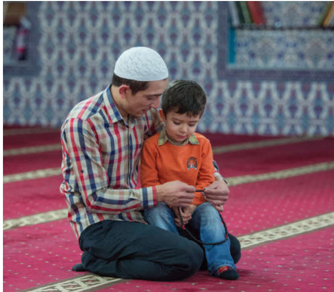
Görsel 47. Kulluk, dünyadaki görevlerimizi de Allah rızası için yapmayı, çalışmayı ve üretmeyi gerektirir.

Yukarıdaki hadiste Hz. Peygamber neyi vurgulamak istemiştir? Yorumlayınız.