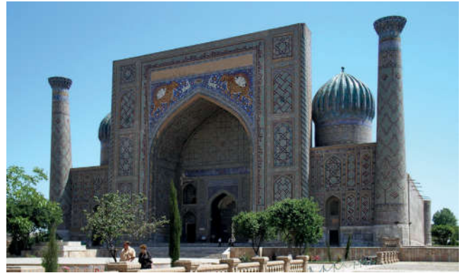
Görsel 63. Bahaeddin Nakşibend Türbesi (Buhara)

Nakşibendilik, Muhammed Bahaeddin Nakşibend'in düşünceleri etrafında oluşan tasavvufi bir yorumdur. M. Bahaeddin Nakşibend, Türkistan'ın Buhara bölgesinde doğmuştur. Onun doğduğu ve yetiştiği çevrede tasavvufun önemli bir yeri vardı. Kendisi de bu durumdan etkilenmiştir. Gösteriştan uzak mütevacı bir hayat süren M. Bahaeddin Nakşibend, kötülüklerden uzak durmuş ve daima iyiliği tavsiye etmiştir.