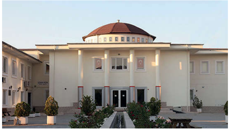
Görsel 65. Nilüfer Belediyesi Cemevi (Bursa)

Cem, sözlük anlamı olarak toplanma, birleşme, birlik olma, bir araya gelme demektir. Cemevi, âyin-i cemin yapıldığı yerdir. Cem için bir araya gelen kimselerin toplandığı yere, erkân yeri anlamında cemevi denir. Erkân ; âdet, yol yöntem, usûl, âdap anlamlarına gelir. Bektaşîlikte ise cemevi yerine “meydan evi” ifadesi kullanılmaktadır.