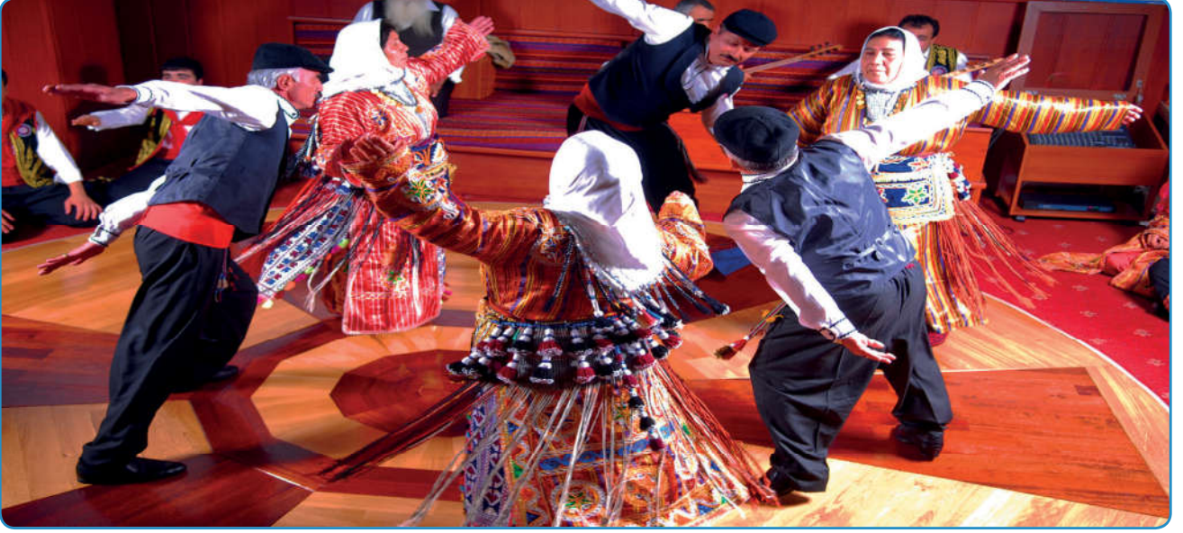
Görsel 68. Alevilikte cem âyini sırasında Semah dönülür.