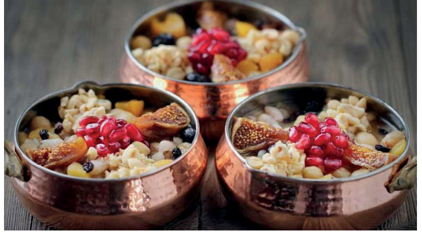
Görsel 70. Muharrem ayında aşure pişirmek bir gelenek haline gelmiştir.

ve damadı Hz. Ali'ye (r.a.) üç gün oruç tutmalarını tavsiye eder. Onlar Hz. Hasan (r.a.) ve Hz. Hüseyin (r.a.)'in iyileşmesi üzerine üç gün adak orucuna niyet ederler. İlk günün akşamı oruçlarını açmak üzere iken bir yoksul gelerek onlardan yiyecek ister. Yiyeceklerini yoksula verirler. İkinci gün yetime, üçüncü günde yiyeceklerini kapılarına gelen esire verirler.