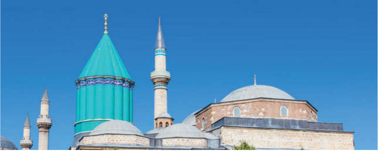
Görsel 61. Hz. Mevlânâ'nın Türbesi (Konya)