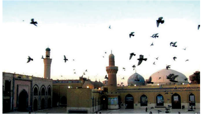
Görsel 60. Abdülkadir Geylani Türbesi (Bağdat)

Kadirilik, Abdülkadir Geylani'nin düşünceleri etrafında oluşmuş tasavvufi bir yorumdur. Kadirilikte diğer tasavvufi yorumlarda olduğu gibi Kur'an ve sünnete uymak esas alınır. Kadiriliğe göre insan, güzel özelliklere sahip olmak için çalışmalıdır. Bu yüzden insanın dinin emir ve yasaklarına uymasının önemi üzerinde durulur. Yoksulların hizmetine koşmak ve onların ihtiyaçlarını gidermelerine yardımcı olmak Kadirilik'te önem verilen bir ilkedir. Verilen sözün yerine getirilmesi, günahlardan mutlak olarak sakınmak, haramlardan uzaklaşmak, alçakgönüllü olmak, kendisine yapılan haksızlık karşısında bile beddua etmemek, dünya malına tamah etmemek önemli değerlerdendir. 11