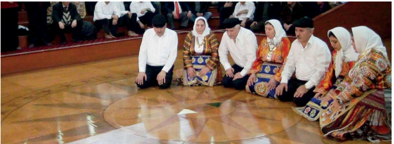
Görsel 66. Âyin-i Cem

Âyin ; kelime olarak tören, merasim, ibadet tarzı, usul anlamlarına gelir. Terim olarak ise çeşitli tekke ve tarikatların hareket ve musiki unsurlarını taşıyan dinî merasim-