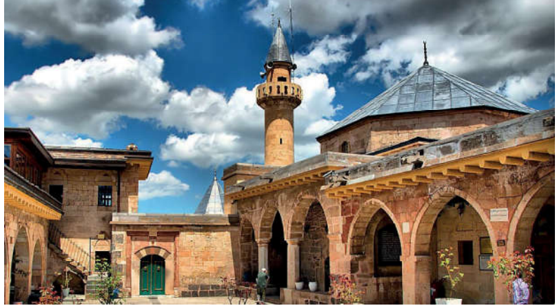
Görsel 64. Hacı Bektaş Velî Türbesi (Neveşehir)

Horasan ve Maverâünnehir bölgelerinde yaşayan Türkler, İslamiyeti kabul ettikleri sırada Hz. Peygamber (s.a.v.) ve onun ehli beytini yani Hz. Ali (r.a.), Hz. Fatıma (r.a.), Hz. Hasan (r.a.) ve Hz. Hüseyin'i (r.a.) derin bir muhabbetle sevdiler ve onlara taraftar oldular. Bu taraftarlığın adına, Ali yanlısı anlamına gelen Alevi denildi. 14