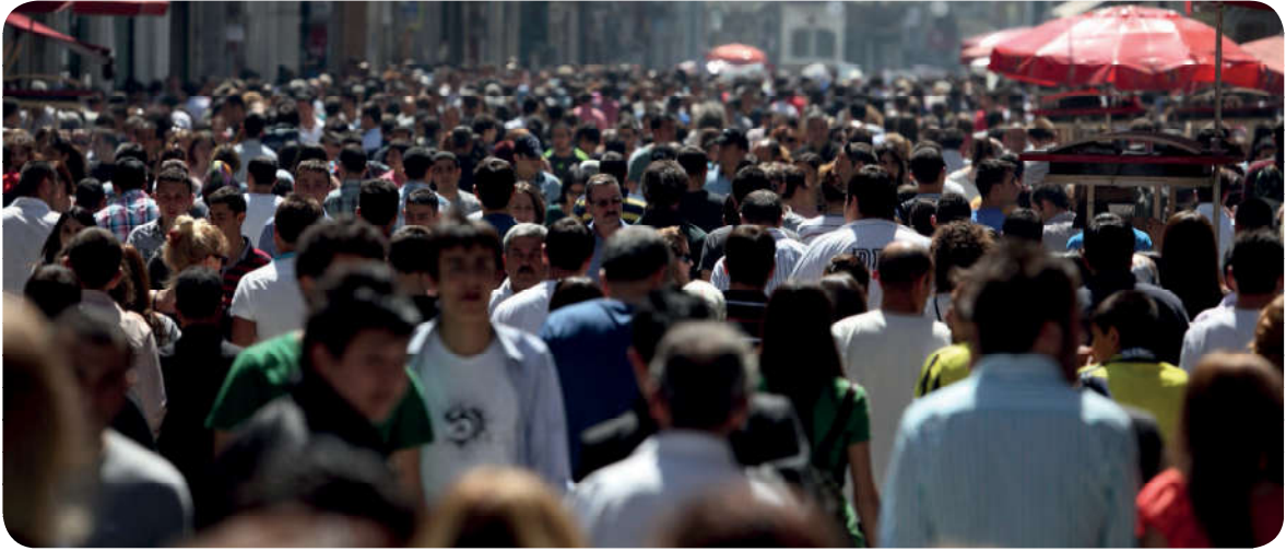
Dinin, bireye olduğu kadar topluma yönelik emir ve tavsiyeleri de vardır.

Dinî değerler etrafında birleşerek yardımlaşan toplumlar yaşadıkları sosyal, ekonomik ve siyasi sorunları daha rahat bir şekilde çözebilir. Çünkü din, bireylerin zor durumlarda birbirlerini gözetmelerini dinî bir sorumluluk olarak görür. Bu yüzden din duygusunun güçlü olduğu toplumlar, zorluklar karşısında daha dirençli olur.