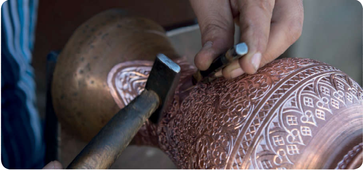
İslam'a göre kişinin kendi el emeğiyle helal kazanç elde etmesi gerekir.

Malın korunması; mülkiyet, ekonomik haklar, üretmek, sahip olmak, satmak ve tüketmek ile ilgili hakları kapsar. İslam'a göre herkes kendi imkân ve ölçüsünde mülk edinme hakkına sahiptir. Her bireyin çalışıp emek sarf ederek meşru yollarla elde ettiği mallarına sahip çıkma ve kazandığı malı harcama hakkı vardır. Kişi haram ve gayri meşru yollar olmamak kaydıyla kazandığı malı biriktirir, satar, gelirinden faydalanır. İslam dini, çalışmayı teşvik eder. Kişinin kendi elinin emeğiyle geçinmesine ve üretmesine özendirir. Bu konuda Yüce Allah şöyle buyurmuştur: "İnsan için ancak çalıştığına karşılığı vardır." 26 Hz. Muhammed (s.a.v.) de "Hiç kimse kendi el emeğiyle kazandığından daha hayırlı bir lokma yememiştir..." 27 buyurarak insanları üretmeye ve geçimini sağlamak için çalışmaya teşvik etmiştir.