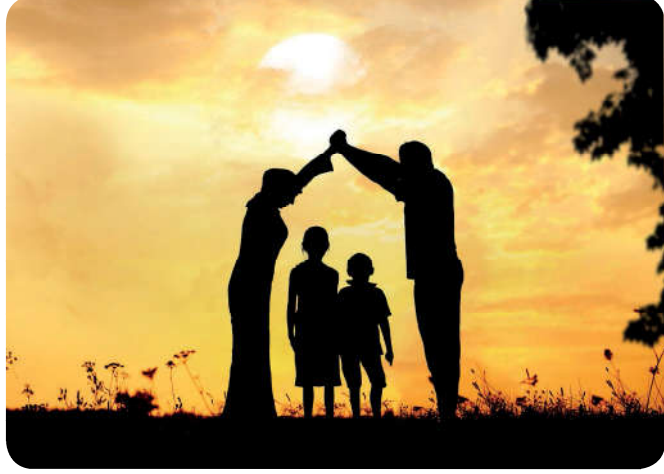
Neslin korunması ailenin korunmasıyla mümkündür.

İslam dininin aileye verdiği önem, kişinin ilk eğitim aldığı sosyal kurum olmasından kaynaklanır. Birey ailede iyiyi doğruyu öğrenir. Hayata hazırlanır. Toplum içinde nasıl davranacağını anne babasından öğrenir. Birey dinî değerleri, güzel ahlaki davranışları anne babasından öğrenerek hayata geçirir. Bu yönüyle aile bir okul gibidir. Anne babalar kazandıkları deneyimlerini çocuklarına aktararak onların gelişimini tamamlamalarına yardımcı olurlar. Çocuklar milli ve manevi değerleri, sevgi, şefkat, merhamet, birlikte iş yapma gibi ahlaki değerleri de aile ortamında edinirler.