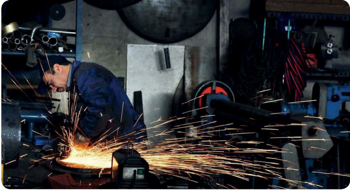
Emeklerin karşılığı zamanında ve tam olarak verilmelidir.

buyrularak insanların mallarının hile, rüşvet, kumar gibi haksız kazanç yollarıyla ellerinden alınması yasaklanmıştır. Kur'an-ı Kerim'de, tartıda hile yaparak haksız kazanç elde edenler kınanmıştır. 29 Ayrıca insanların emeklerinin karşılığını vermek emredilmiştir. Kur'an-ı Kerim'de "İnsanların mallarını ve haklarını eksiltmeyin. Yeryüzünde bozgunculuk yaparak karışıklık çıkarmayın." 30 buyrularak hak edilen emeğin noksan ödenmemesi istenmiştir. Emeğin korunması ve gözetilmesi konusunda Hz. Muhammed (s.a.v.) de şöyle buyurmuştur: "Çalışana ücretini teri kuru-madan veriniz." 31