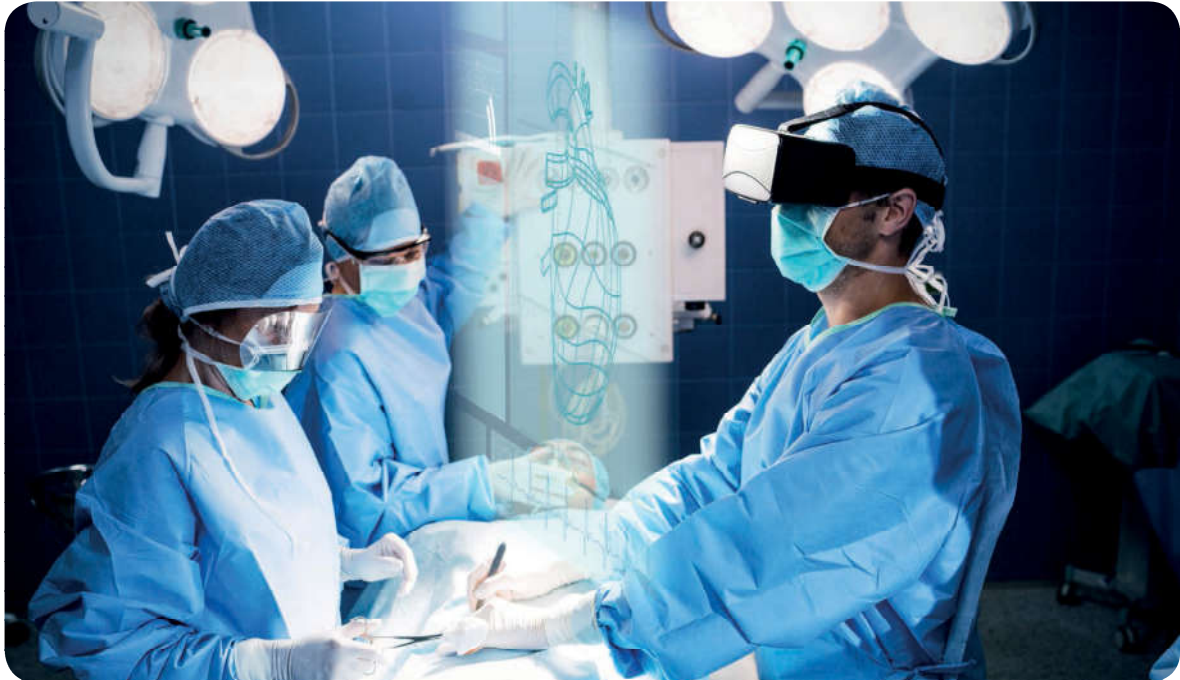
İslam dini, canın korunması kapsamında şifa aramayı ve tedavi olmayı tavsiye eder.

Canın korunması İslam dinine göre en temel haktır. Çünkü bireyin varlığını sürdürmesi, iş ve faaliyetlerini devam ettirebilmesi buna bağlıdır. Bu yüzden İslam bireyin yaşama hakkını henüz anne karnında iken güvence altına alır. Bu konuyla ilgili Kur’an-ı Kerim’de şöyle buyrulur: “Fakirlik korkusuyla çocuklarınızın canına kıymayın. Biz onların da sizin de rızkınızı veririz. Onları öldürmek gerçekten büyük bir günahdır.” 14