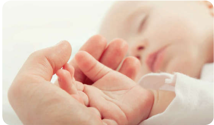
İnanmak doğuştan gelen bir ihtiyaçtır.

Maddi yönüyle beslenme, giyinme, barınma, dinlenme gibi ihtiyaçları olan insanın, manevi açıdan da güvenme, bağlanma, inanma gibi ihtiyaçları vardır. İnsanın biyolojik ihtiyaçları nasıl doğuştan geliyorsa manevi ihtiyaçları da doğuştandır. Bu yönüyle insandaki inanma ihtiyacı da fitrîdir. İnsanda her zaman yüce ve güçlü bir varlığa güvenme, ona sığınma ve ondan yardım isteme eğilimi vardır. İnsanın bu isteklerini en güzel şekilde karşılayan dindir.