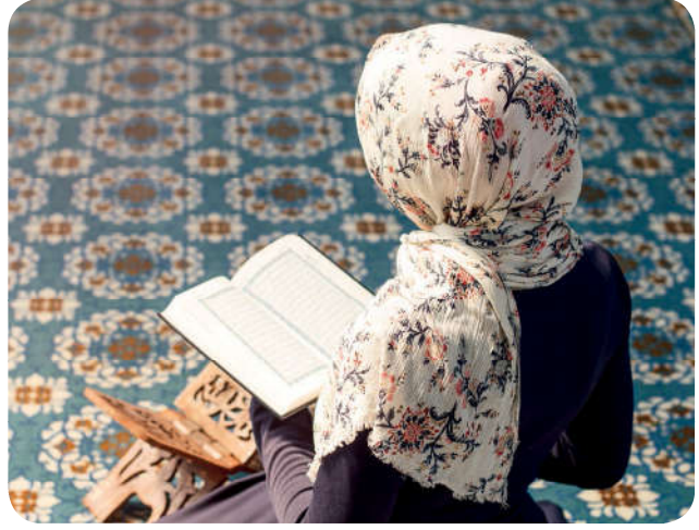
Kur'an-ı Kerim dinin korunmasında temel başvuru kaynağıdır.

Dinin korunması Allah'ın (c.c.) haklarının ve sınırlarının muhafazasıyla mümkündür. Helaller ve haramlar Allah'ın (c.c.) koyduğu sınırlardır. Bu sınırlar insanların kötü şeylerden uzaklaşması ve iyi olana yönelmesi için ortaya konulan hükümlerdir. Kur'an-ı Kerim'de, bu sınırlara riayet edilmesi emredilmiştir. 42 Dinin korunması bireysel bir sorumluluk olduğu kadar toplumsal bir görevdir. Çünkü toplumun kurtuluşu ve huzuru Allah'ın (c.c.) sınırlarının korunmasıyla mümkündür.