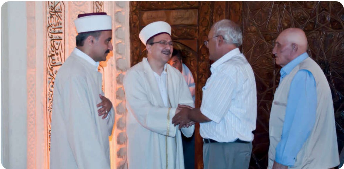
Camiler, Allah’ın (c.c.) zikredildiği ve kalplerin huzur bulduğu mekânlardır.

İnsan günlük hayatında pek çok olumsuzluklarla karşılaşır. Örneğin; kendini yalnız hisseder, çaresiz kalır. Değişik korkulara kapılabilir. Hastalıklarla ve musibetlerle uğraşmak zorunda kalabilir. Felaketlerle yüzleşebilir. Allah ve ahiret inancı, bütün bu olumsuzluklara karşı insana dayanma gücü verir. İnsan dünya ve ahiret mutluluğunu din sayesinde elde eder. Nitekim Kur’an-ı Kerim’de Yüce Allah şöyle buyurmaktadır: “... Haberiniz olsun, kalpler yalnızca Allah’ın zikriyle tatmin bulur. ” 7