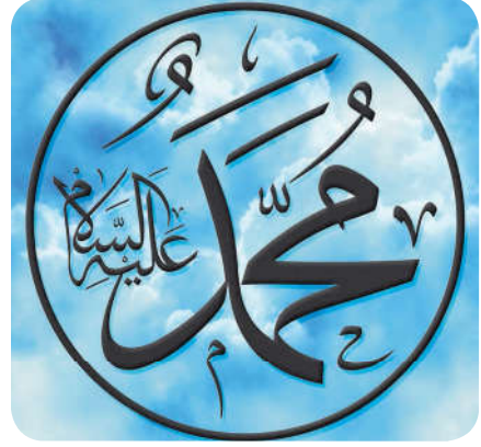
Hz. Muhammed'in (s.a.v.) adının yazıldığı hat örneği.

Yüce Allah'ın emir ve yasaklarını insanlara bildirmek için seçip görevlendirdiği kimselere peygamber denir. Allah (c.c.), her topluma kendi içlerinden bir peygamber göndermiştir. Peygamberlerin görevlerini yapabilmeleri için bir takım özelliklere sahip olması gerekir. Bunlar; doğruluk, güvenilirlik, emaneti korumak, akıllı ve zeki olmak, günah işlememek, Allah'tan (c.c.) aldığı mesajları değiştirmeden insanlara ulaştırmaktır. Peygamberler, sahip oldukları bu niteliklerle insanlar için en güzel örnektir. Hz. Muhammed (s.a.v.) de diğer peygamberler gibi üstün ahlaki nitelikleriyle insanlara en güzel örnek olmuştur.