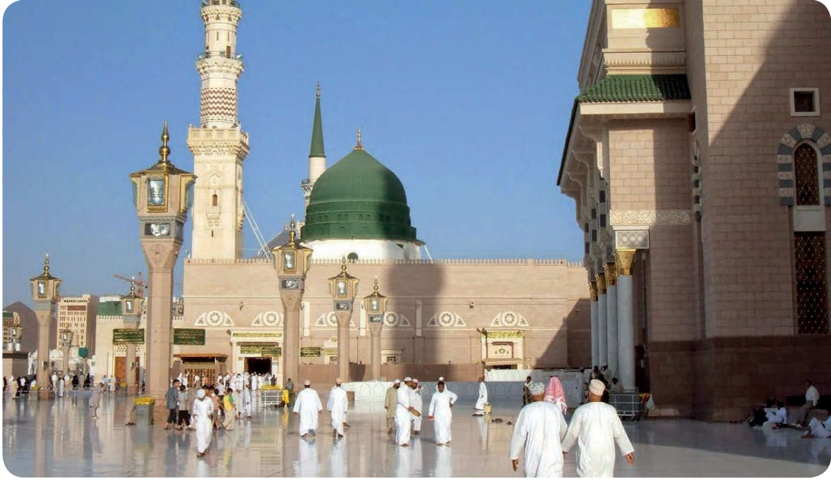
Hz. Peygamber ayırım yapmaksızın tüm insanlara değer verirdi.

Hz. Peygamber Müslüman olmayan komşularıyla iyi ilişkiler kurmuş, komşuluk haklarına dikkat etmiş, hastalandıklarında onları ziyaret etmiştir. Vefat ettiklerinde cenazelerine saygı göstermiş 30 , kendisine sıkça uğrayan bir Yahudi çocuğunu hastalandığında ziyaret ederek memnun etmiştir. 31